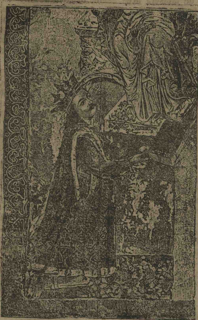
Chipul lui Ștefan cel Mare, pe evanghelia din biserica dela Voronet, Bucovina.