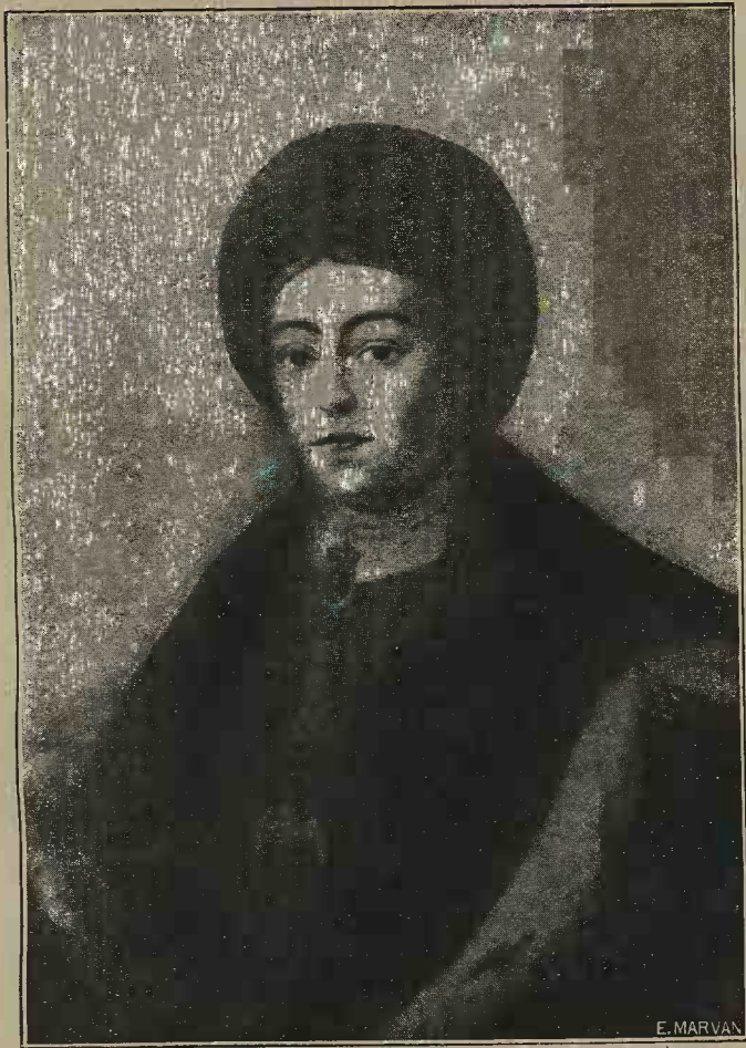
Casandra, fiica lui Șerban Cantacuzino și Doamna lui Dimitrie Cantemir († 1713).

După o fotografie din Biblioteca Academiei Române.