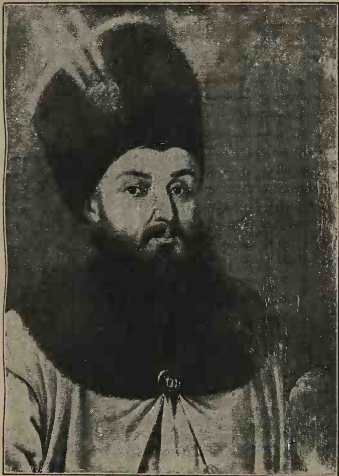
Antonie Vodă Rusăt (1675-1678).

După o fotografie de frescă din colecția de stampe a Academiei Române. Portrete de Domni moldoveni : A, II, 19.