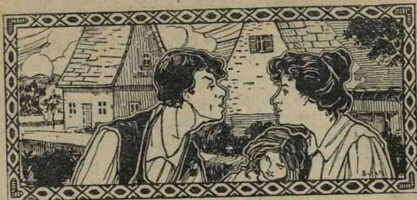
DESEN ORIGINAL DE ȘIRATO.