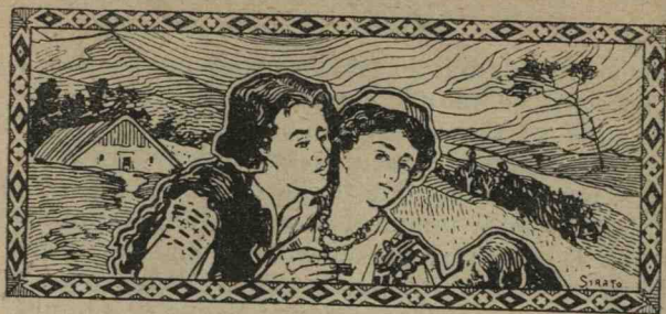
DESEN ORIGINAL DE SIRATO.