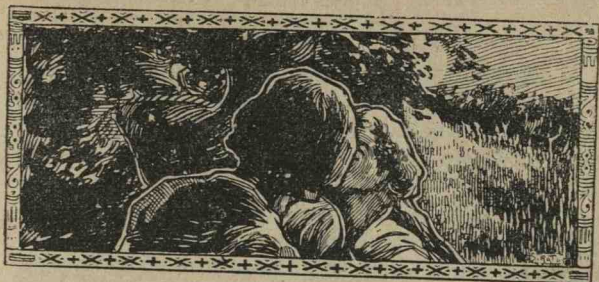
DESEN ORIGINAL DE ȘIRATO