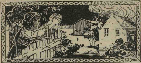
DESEN ORIGINAL DE ȘIRATO.