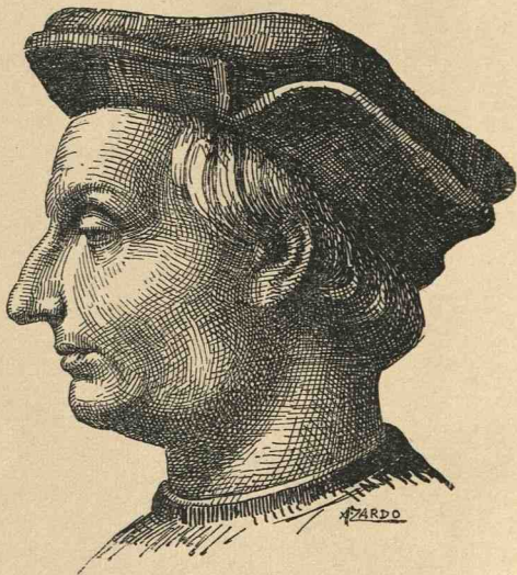
Incisione di A. Zardo da un dipinto di ignoto.