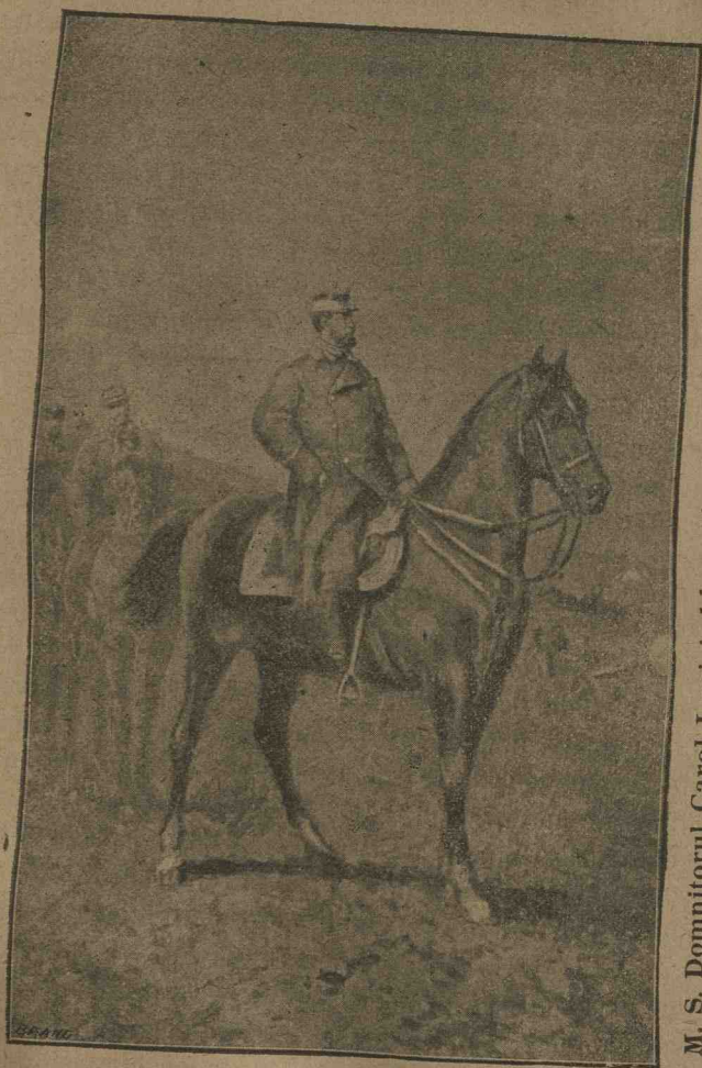
M. S. Domnitorul Carol I privind la peripețiile luptei de la Gorni Dubnic din ziua de 12 Octombrie 1877 din înălțimea de la Krișina.

În acest timp lupta își urmase cursul său distrugător. Ziua se inaugură rău pentru Ruși, perderile ce încercară deveneau prea simțitoare, neînfrînatul curaj al grenadirilor