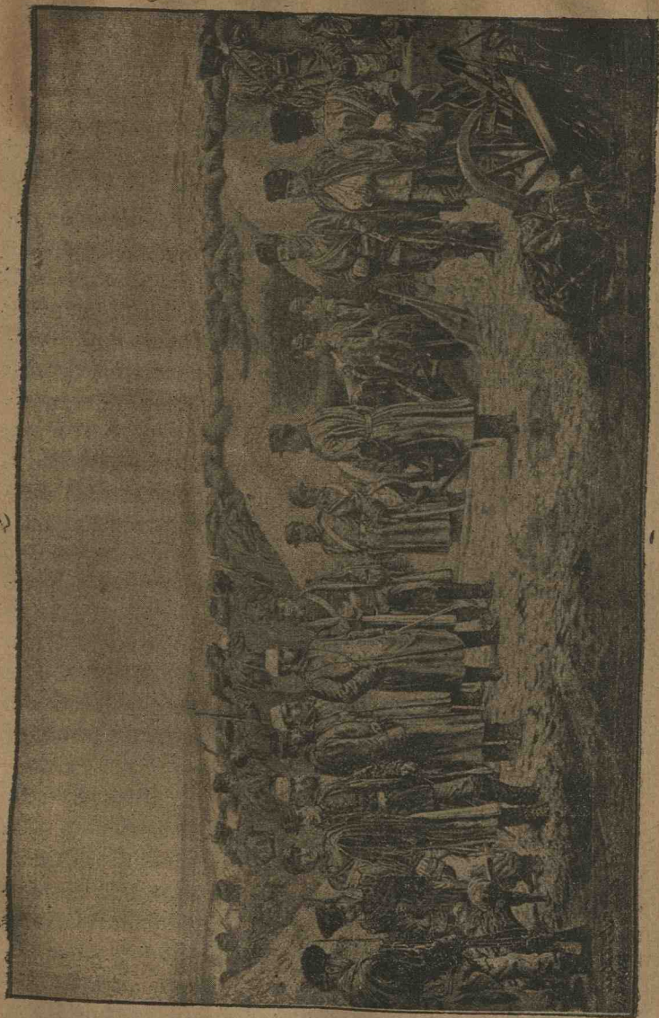
M. S. Domnul Carol I inspectează o paralelă innaintată în facia redutei Grivița No. 2 în ziua de 31 Octombrie anul 1877.