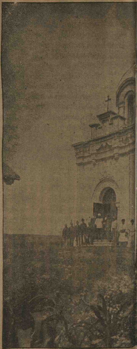
Biserica Sf. Dumitru din satul Gri pe mormântul eroilor morți,

Pe când soldații Románi își îndeplinéu acéstă piósă datorie faciá cu camaradii și cu șefii lor cădúți pe câmpul de onóre, același act săvârșéu și Rușii în tótă întindearea dintre Krișina și Radisovo, de și ei nu se bătuse în a-jun; ei seocupară cu stringe-