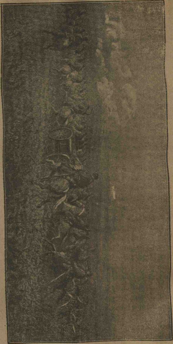
O baterie de Artilerie călătorească urmărind pe fugarii Turci în Raehova din ziua de 9 Noiembrie 1877.