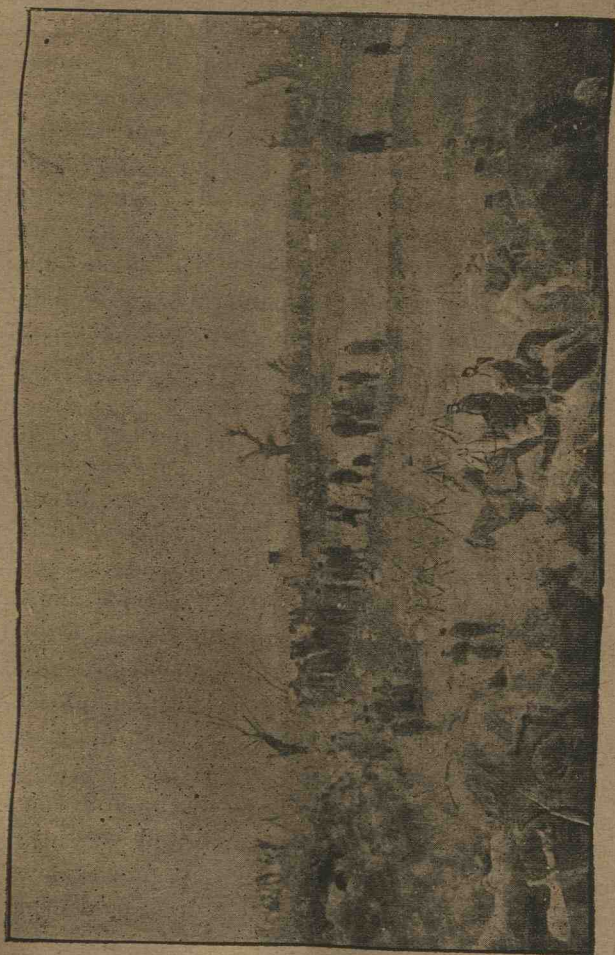
În[acceptarea atacului Grivățel No. 2 în ziua de 7 Octombrie 1877.

cuția aceluși atac pentru a treia oară. Imediat după luarea acestei hotărâri, comandamentul general luă dispoziții în consecință. Vestea că a treia oară avea să se dea un atac serios iar nu