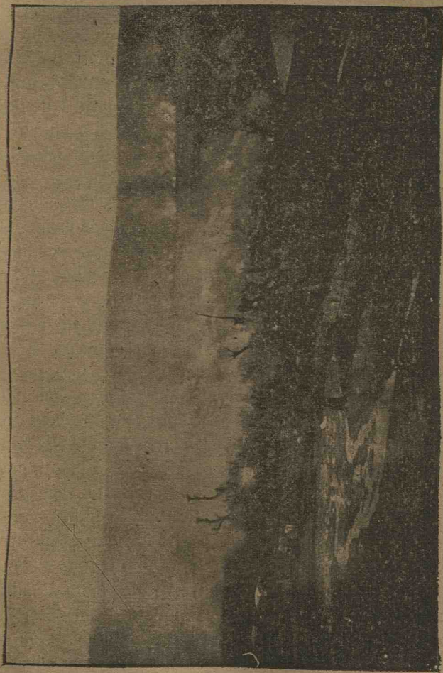
Bombardarea Griviței No. 2 în ziua de 6 Septembrie 1877

A doua zi din cauza acestui atac se hotărî aducerea la în-