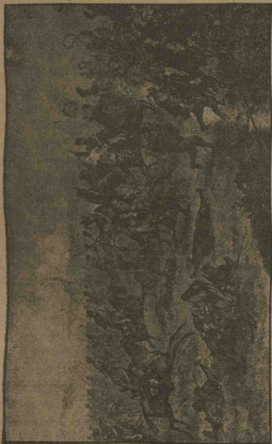
Bătălia de la Rachova dintre Români și Turci din ziua de 9 Noembrie 1877 pe marginea râului Săhit.

șiróe din ranele sale, ci numai de cât se așeză pe un pat por-piciórelor. El căđu, ómenii ambulánțelor îl ridicară pe dată, dar dinsul nu-și perdu de loc cumpátul, de și sângele curgea tativ de ambulánță, și fără să ascepte să fie legat la râní, con-tinuă înainte d'a comanda.