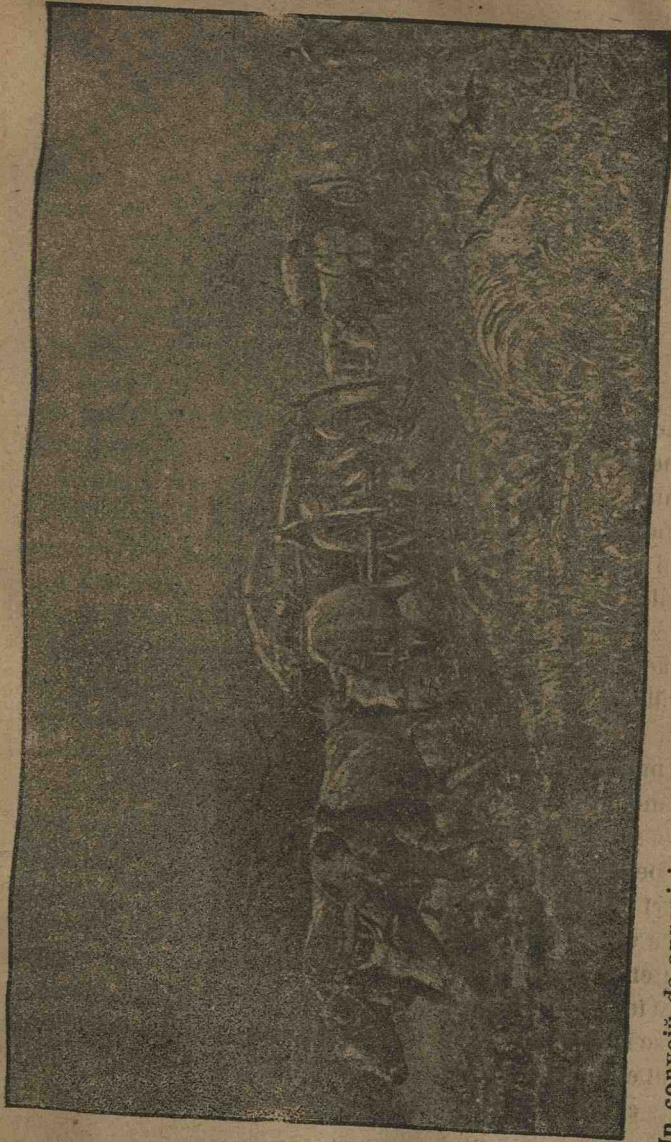
Un convoi de aprovizionare mergând spre Plevna pe drumul dintre Neapole și Verbița pe la finele lunii Septembrie 1877.