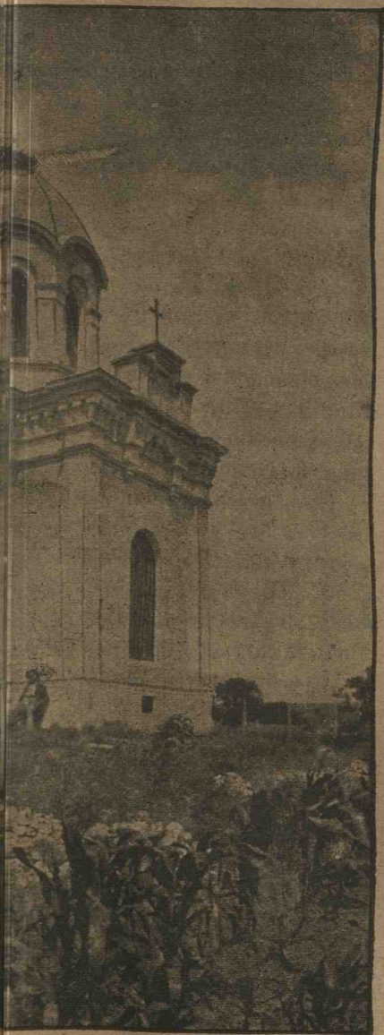
Bulgaria) clădită de armata română înțită la 7 Octombrie 1877.

rea celor căzuți mai înainte. Asemenea și Turcii în tot spațiul dintre Krișina și Opanez eșiră din tabii pentru ași îndeplini aceeași datorie umană față cu ai lor. În timpul acestor trei ore de armistițiu, inimicil de erii și de mâne se întâlniră sub protecția crucei și a semilunei roșii, se atinse, se încrucișară și chiar se ajutară reciproc la unele ocazii spre a'și împlini pișosa lor datorie, fără a da la ivelă cel mai mic sentiment de ură, de fanatism și de repulsiune și fără să se întâmple cel mai neînsemnat incident.