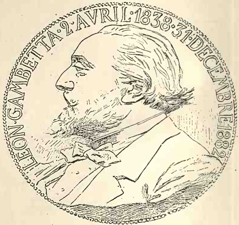
MÉDAILLON DE GAMBETTA PAR J.-C. CHAPLAIN