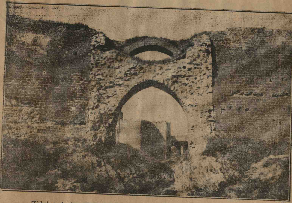
Zidul exterior al Cetăței noi. Arcada pe sub care curge părăul