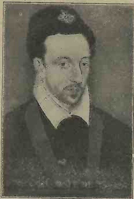
HENRI III (Musée Condé à Chantilly.)

Après dix-huit mois, ayant beaucoup promis, peu accordé, elle tourne les talons avec l'espoir d'avoir amené la trêve dont le pays a tant besoin. C'est une illusion. Condé, Navarre, les huguenots reprennent les armes. La flotte française est détruite par l'amiral espagnol Santa-Cruz, près de l'île