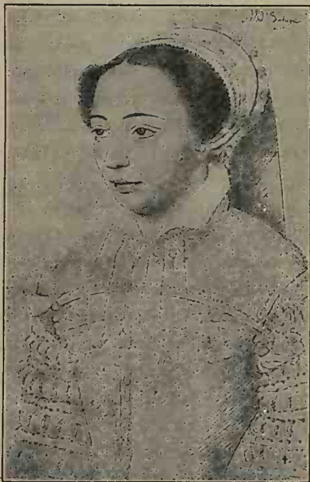
CATHERINE DE MÉDICIS A VINGT-DEUX ANS D'après un crayon du Musée Condé à Chantilly.

C'est une excellente mère, toujours au courant de tout