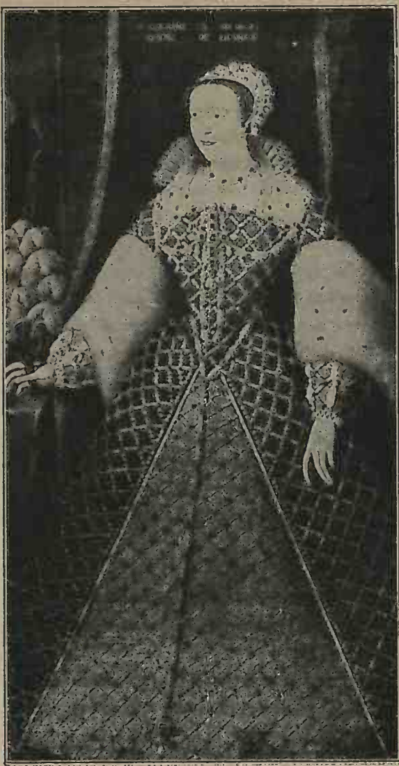
CATHERINE DE MÉDICIS EN COSTUME DE COUR (Galerie des Offices, Florence.)