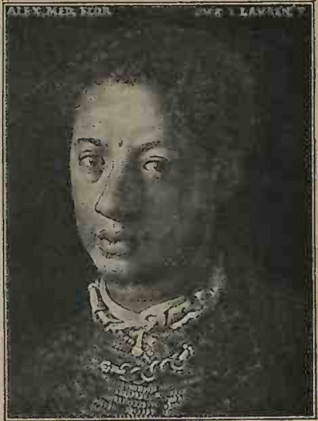
ALEXANDRE DE MÉDICIS, FRÈRE DE CATHERINE, par Bronzino. (Galerie des Offices, Florence.)

Catherine est une enfant chétive et sans voix. Les plus funestes présages accompagnent sa venue au monde. Les astrologues ont découvert des taches rougeâtres sur le disque de la lune, une longue écharpe de vapeur sanglante semble flotter dans le ciel. Des plaintes mon-