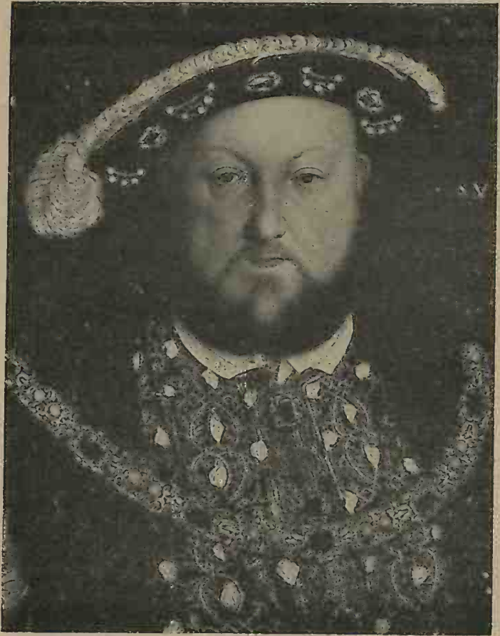
HENRY VIII par Hans Holbein.