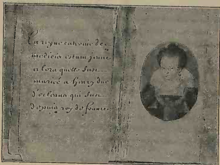
CATHERINE DE MÉDICIS A L'ÉPOQUE DE SON MARIAGE Miniature ornant Le Livre d'Heures de Catherine de Médicis .

Le 12 octobre 1533, Marseille est dans l'allégresse. Les signaux de la tour d'If et de Notre-Dame-de-la-Garde viennent d'annoncer que la flotte pontificale approche, amenant Clément VII et sa nièce, la fiancée du fils du roi, la jeune Catherine de Médicis.