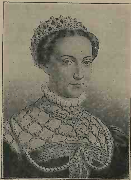
ANNE DE PISSELEU, DUCHESSE D'ETAMPES, FAVORITE DE FRANÇOIS I er

Catherine est un modèle de réserve, ne cherchant qu'à s'effacer et à rester en bons termes avec tous, à ne pas se heurter contre la force irrésistible qu'est devenue Diane. Si Henri a un très grand amour pour sa maîtresse; il a une ferme amitié pour sa femme.