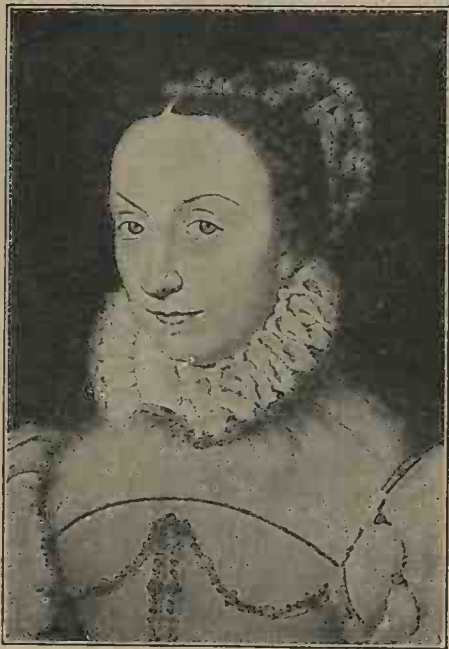
JEANNE D'ALBRET, MÈRE DE HENRI IV par François Clouet.

La mort soudaine de Jeanne d'Albret ne retarde pas les préparatifs du mariage. Henri de Navarre arrive à la Cour. Catherine a invité le ban et l'arrière-ban des