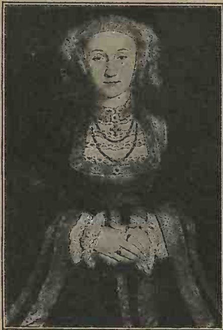
ANNE DE CLÈVES par Hans Holbein.

Que pense et que dit le peuple anglais des extravagances et des folies amoureuses de son roi? Certains se montrent sévères et le comparent à Satan, prince de