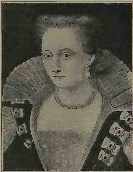
LOUISE DE LORRAINE, ÉPOUSE DE HENRI III

donné le signal de la Saint-Barthélemy. Elle se souvient avec terreur d'une prophétie, lui prédisant qu'elle mourrait dans un palais, près de Saint-Germain. Elle se réfugie à l'hôtel de Soissons, où elle peut voisiner avec Cosme Ruggieri, qui, du haut de sa co-