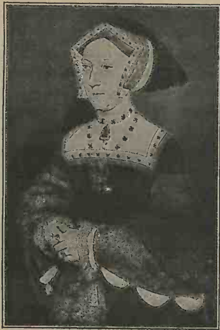
JANE SEYMOUR par Hans Holbein.

Thomas Cromwell, pour satisfaire son maître, guette, observe et se charge de cette vilaine besogne. La reine, sortant de sa chambre, rencontre un jeune joueur de flûte de la musique du roi, Mark Smeton. Elle s'arrête un instant pour lui parler. Des propos aimables, qui peuvent passer pour une déclaration d'amour, sont entendus par les espions à la solde de Cromwell. Smeton est arrêté, mis à la torture. Il avoue être l'amant de la reine. Deux autres gentilshommes sont impliqués dans les poursuites pour adultère sous le chef de haute trahison envers le roi.