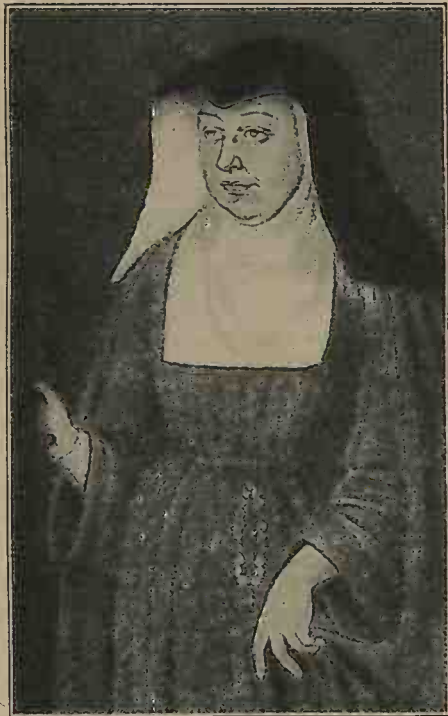
CATHERINE DE MÉDICIS A SOIXANTE ET UN ANS, EN HABIT DES SŒURS DE SAINTE-CLAIRE

Son mal s'aggrave; les médecins sont impuissants, elle