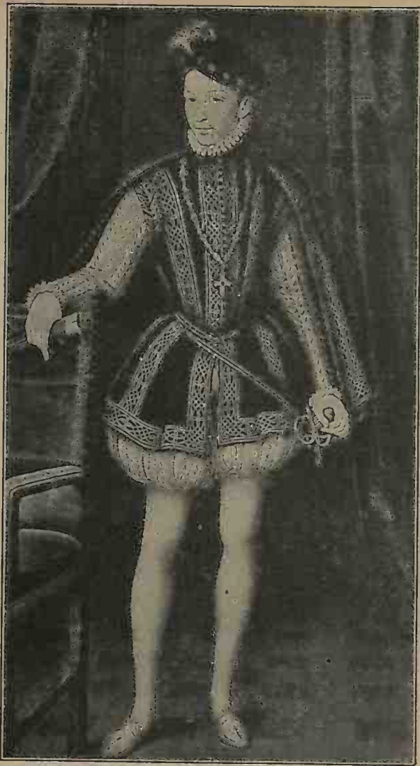
CHARLES IX par François Clouet.