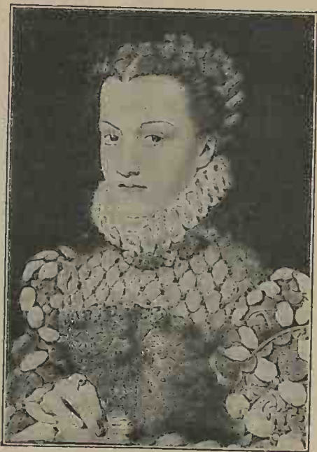
ELISABETH D'AUTRICHE, ÉPOUSE DE CHARLES IX.