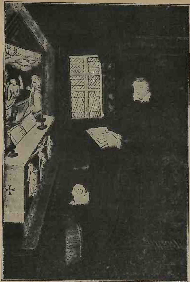
ORATOIRE PORTATIF DE CATHERINE DE MÉDICIS D'après un émail (Musée de Cluny).