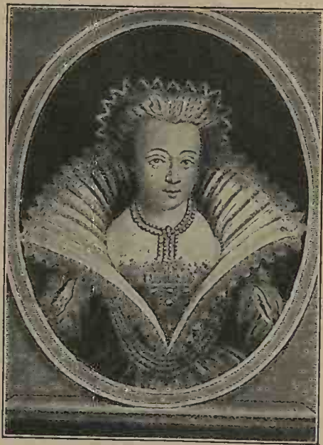
MARGUERITE DE VALOIS, FILLE DE HENRI II ET PREMIÈRE FEMME DE HENRI IV

le duc d'Alençon, petit et les jambes grêles, est un homme de cheval. Henri III n'a de goût que pour la mollesse et les frivolités. Ce n'est pas là le héros sans peur et sans reproche dont sa mère a rêvé.