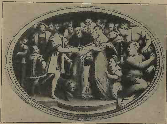
LE MARIAGE DE CATHERINE DE MÉDICIS Peinture de Vasari. ( Palais Vieux, Florence. )

est l'ornement de la Cour, Catherine est trop fine pour ne pas se concilier ses bonnes grâces; elle a le pressentiment qu'elle doit, avant tout, compter sur l'appui et l'affection de François I er . Son beau-père est conquis par la