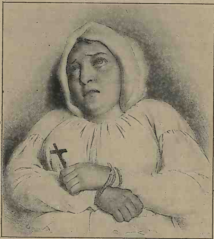
LA MARQUISE DE BRINVILLIERS

La Chaussée, cet infirmier modèle, touche de la marquise