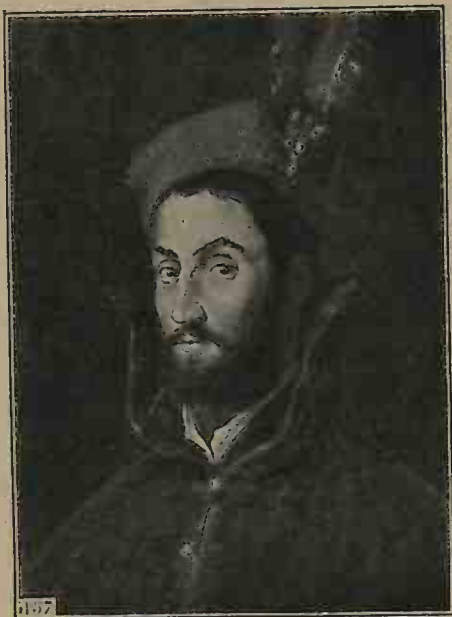
LE CARDINAL HIPPOLYTE DE MÉDICIS, COUSIN DE CATHERINE Portrait du Titien.

La vieille tante au caractère revêché et à l'aspect rébarbatif a été remplacée par Marie Salviati, femme de Jean des Bandes Noires. Le pape Clément VII a un caractère fuyant. Sa nature est remplie de contradictions; il songe sérieusement à trouver un mari pour sa nièce, mais il change d'avis presque chaque jour sur le choix du prétendant. Il déclare qu'il ne veut pas se ruiner en courriers pour l'établir.