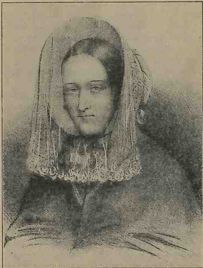
MADAME LAFARGE, NÉE MARIE CAPPELLE