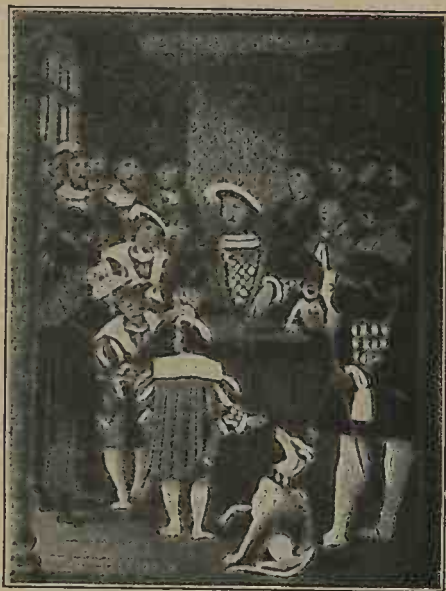
FRANÇOIS I er ENTOURÉ DE SES ENFANTS ET DE SA COUR, VERS 1532

Diane de Poitiers, comtesse de Brezé, — « Mme la Sénéchale », ou « la Grande Sénéchale », c'est ainsi qu'on l'appelle, — a vingt ans de plus que Henri. Elle lutte âprement et avec succès contre les morsures de l'âge. Les pam-