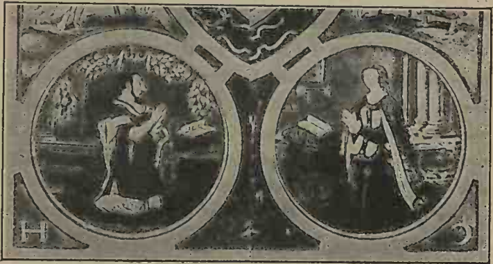
HENRI II ET CATHERINE DE MÉDICIS EN COSTUME DE SACRE Email de Léonard Limousin, point en 1553. (Musée du Louvre.)

« A six heures, souper en famille; deux fois par