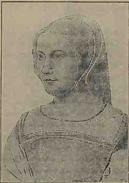
DIANE DE POITIERS par Clouet.

« Mon compère. Je vis, hier soir, ce que vous me me mandez tou-