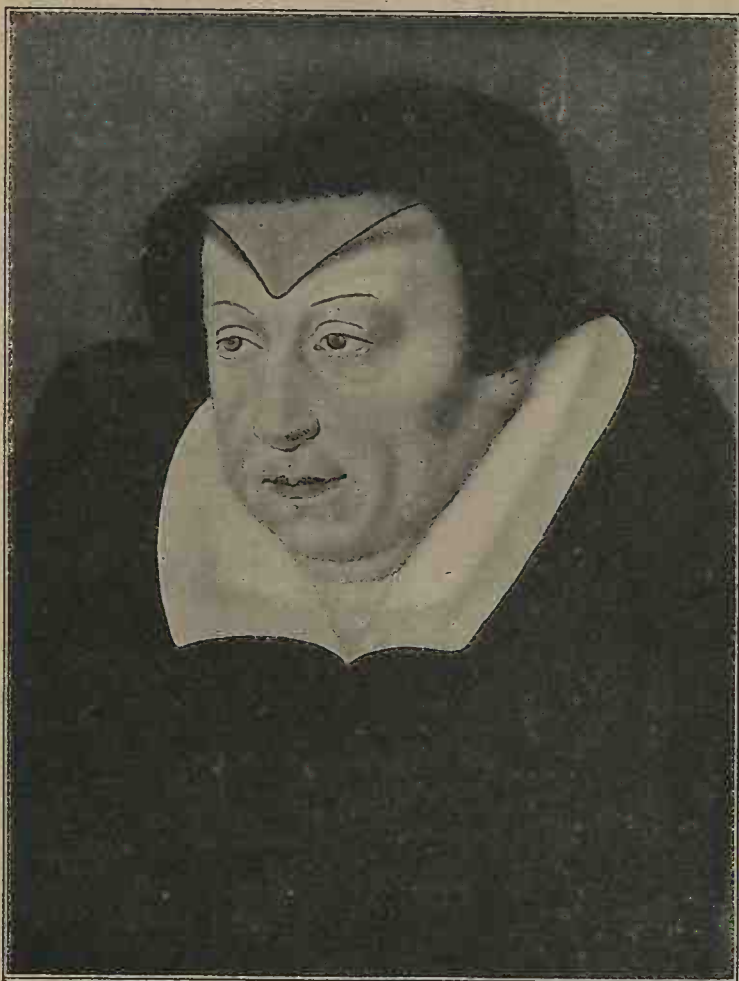
CATHERINE DE MÉDICIS DANS SES VÊTEMENTS DE DEUIL