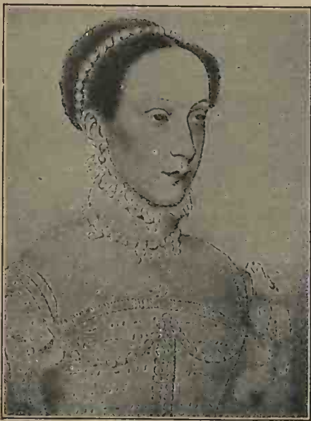
MARIE STUART A DIX-SEPT ANS Crayon de François Clouet.

table. Elle croit au Paradis, à l'Enfer, à Dieu et au Diable. Pour le reste, elle n'est guère fixée. La politique règne en maîtresse dans son esprit. Elle a ménagé le protestantisme jusqu'au jour où elle a acquis la convic-