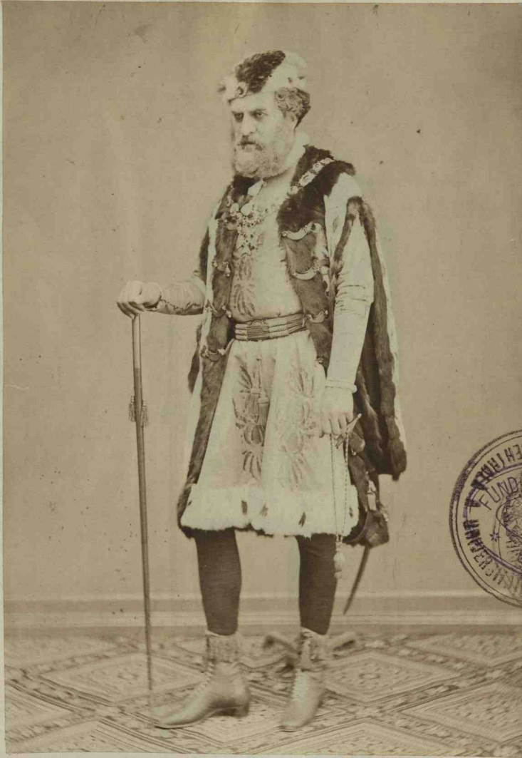
Bucioc. Vê măneacăreși des de diminetă, măriți boerî... (scena II).