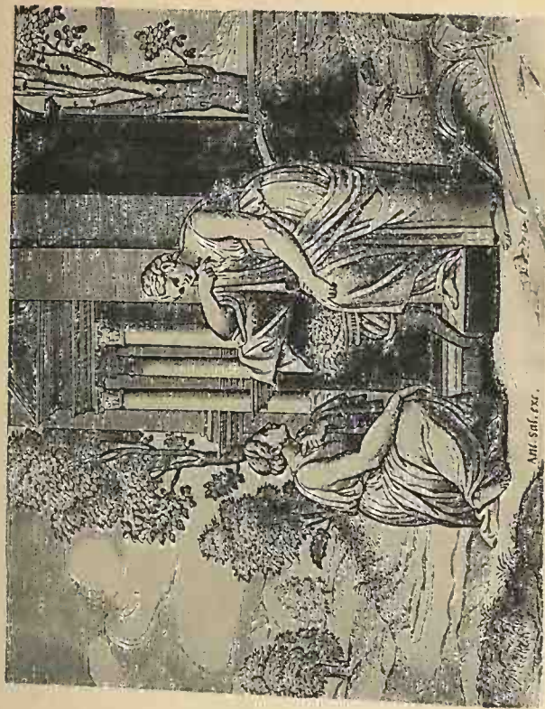
PSYCHÉ. LA TRIEUSE DE GRAINES Gravure de Marc-Antoine, d'après un tableau de Raphaël (Bibliothèque Nationale, Cabinet des Estampes)