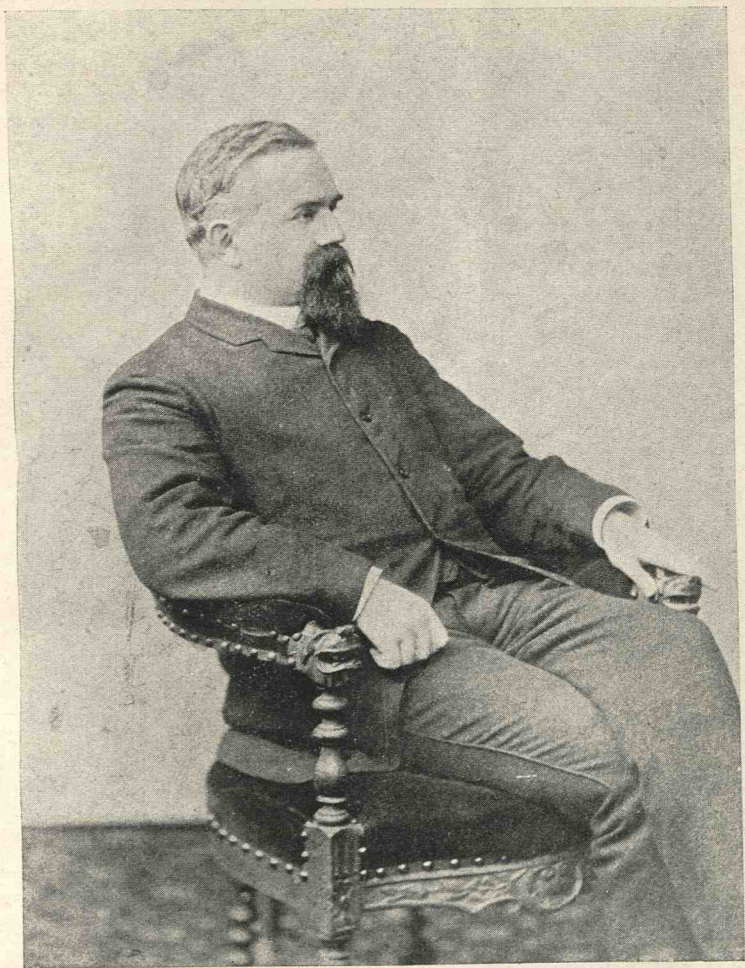
Titu Maiorescu fotografie de prin 1891–92