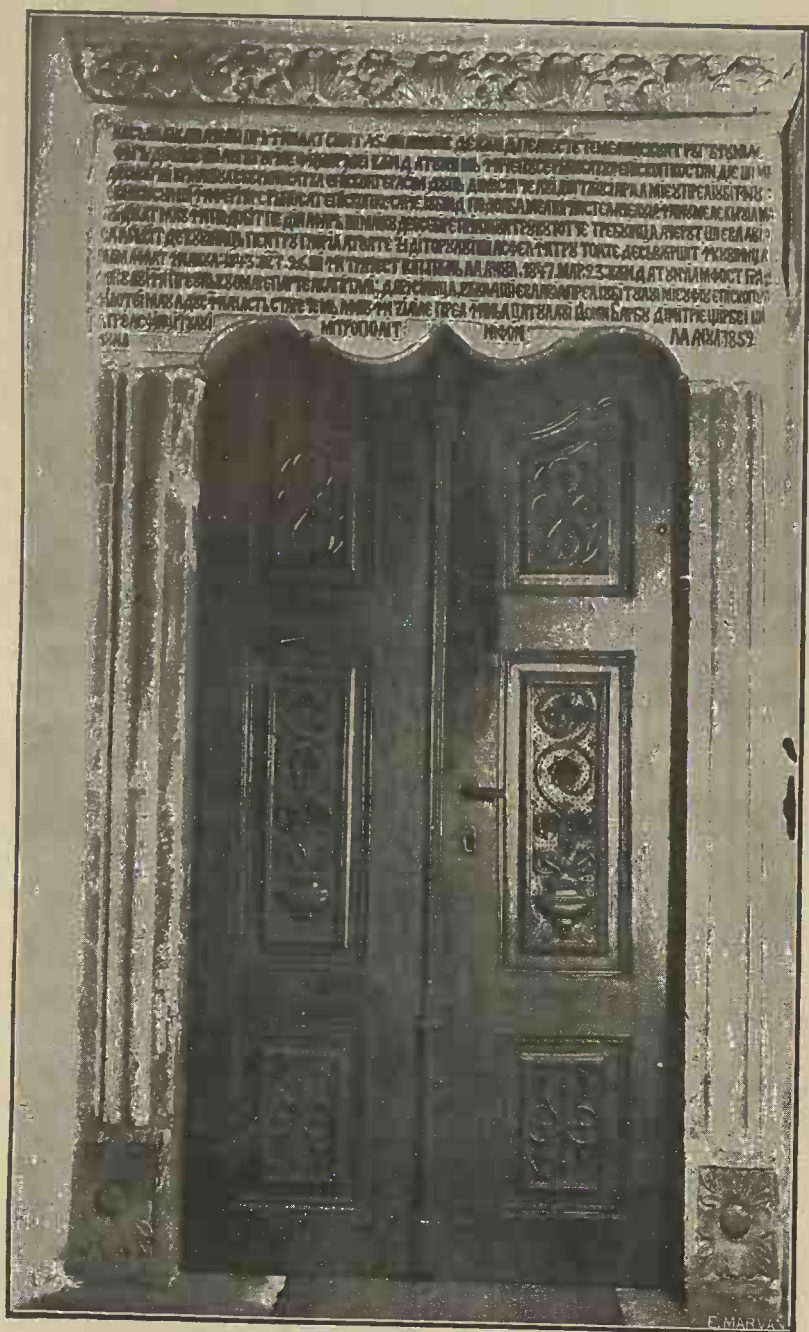
Inscripția și ușa de la 1852 încadrată în chenarul vechi