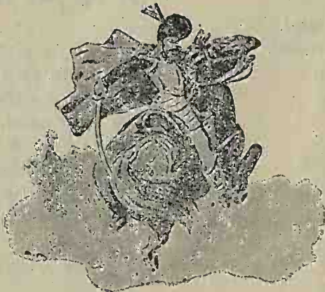
Mihai-Viteazul, de Ary Murnu.