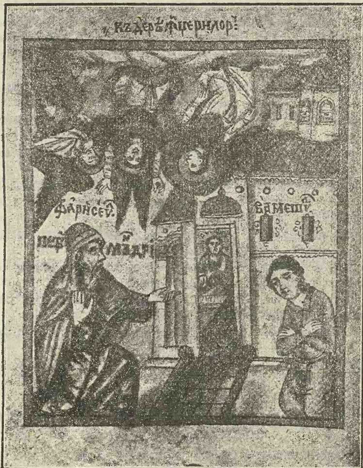
Fig. 1. Căderea Îngerilor (iconiță de pe o cărticică din c. 1720 (2).

tului, alții în fundul mării, alții pre pământ, alții în văzduh, alții într'apă. Și toți aceia căț[i] au căzut de în cer [cu] acel voevod, făcutu-s'au diavol întunecat..." (1).