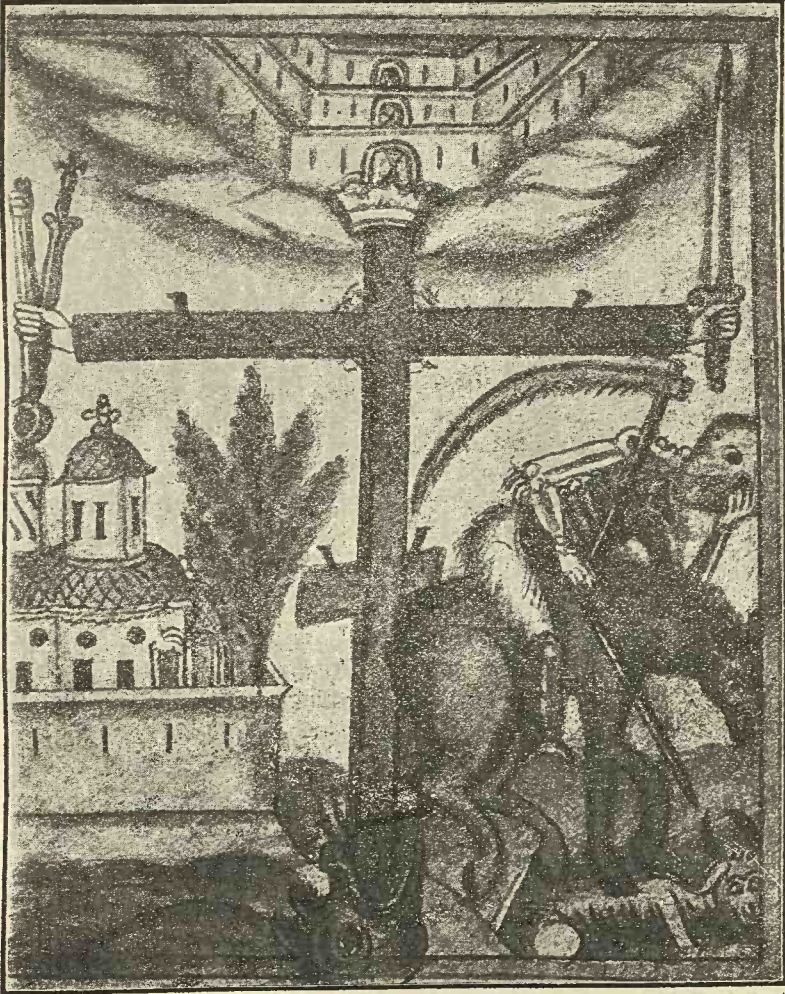
Fig. 3. Dărâmarea Morții și a Diavolului.

șirea în cinste și'n ușurarea de păcate a vieții sale, căci numai astfel Moartea cea dureroasă va fi isgonită, adică, numai astfel se va putea pregăti adevărata vicață ; și atunci, omul trebuie să strige creștinește: