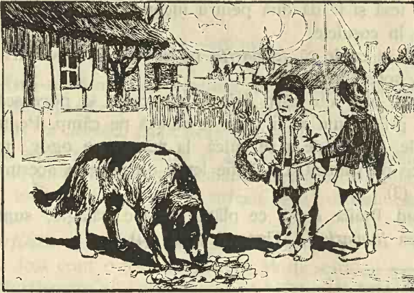
Fig. 3. Copiii umblând cu Câții-mâții , au răsturnat coșul cu ouăle de frica cânelui.

Mai de mult se spune că acei colindători erau flăcăi chiar, și pârliau fetele leneșe cari aveau încă neisprăvit torsul călților (1). Acești flăcăi umblau prin jud. Dolj cu căldărușele cu jaratec