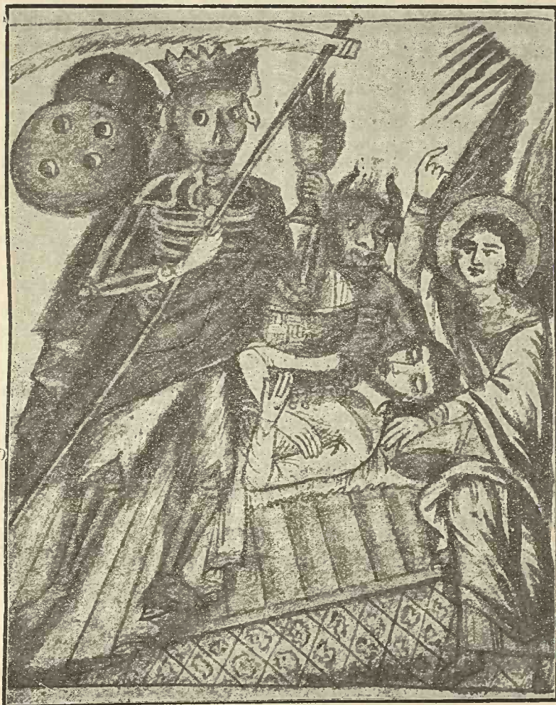
Fig. 4. ...Moartea mi-au sosit și Dracul m'au năpădit... 𐄂

Ne mai având ce să răspundă, moșneagul cu pricina și-a plecat capul și a mers după Moarte!“ (1).