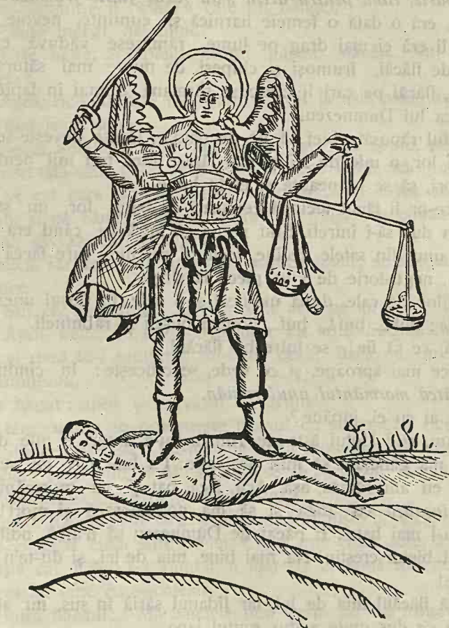
Fig. 2. Ingerul (Arhanghelul Mihail) cântărește, după lumea sufletului faptelor răposatului (după Bianu și Hodoș, Bibliografia românească veche , I, p. 202).

În cele ce urmează, vom da o frumoasă povestire musceleană,