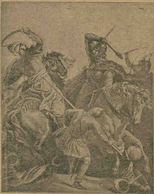
Lupta dela Varna.

Turcii învinseră și acum, dar pe lângă pierderi atât de mari, încât însuș Sultanul a exclamat: „O astfel de învingere doresc numai dușmanilor mei“. Peste 40 de mii de Turci morți acopereau câmpul de luptă.