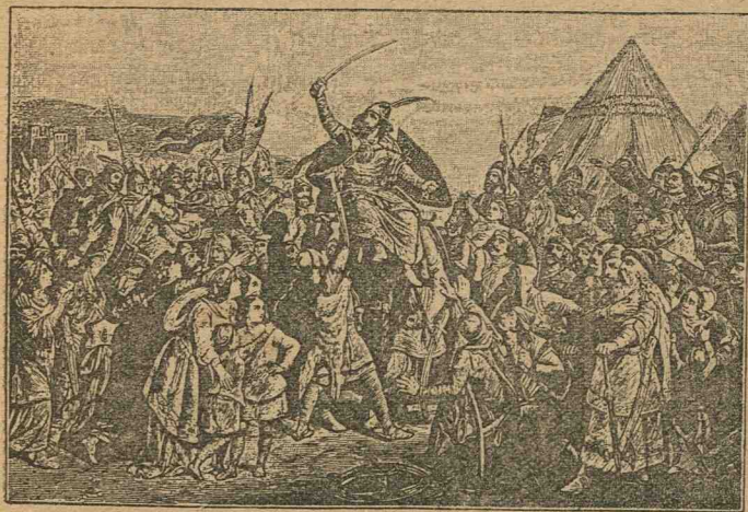
Alegerea lui Árpád de conducător.

tenie. 2. Din ce vor câștiga împreună, deoptrivă se vor împărtași. 3. În lucrurile mai însemnate ale poporului, Árpád întotdeauna va cere sfatul frun-