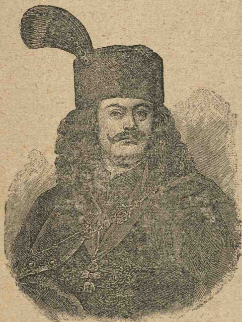
Francisc Ráko i II.

După reocuparea cetății Buda, regele sub cuvânt că a scăpat patria de Turci, voi s'o contopească în Austria, făcându-o provincie, ca celelalte provincii ale sale. Începù deci a domni iarăș absolutistic. Uitând jertfele Maghiarilor, suferi ca guvernatorii săi să le răpească drepturile și avuturile, ba chiar și vieața.