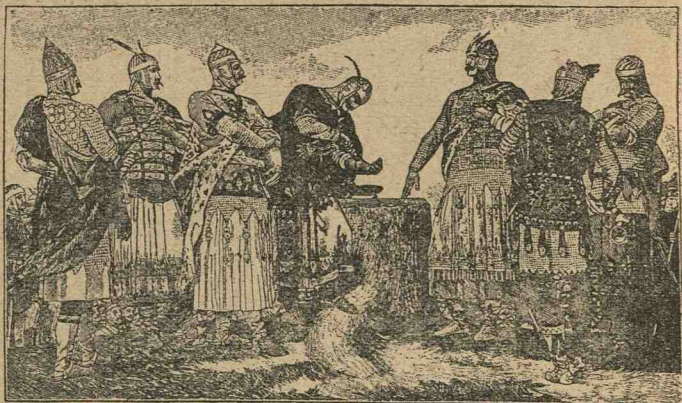
Contractul de sânge.

tașilor țării. 4. Celui ce va călca jurământul să i-se verse sângele și 5. Blăstăm asupra aceluia principe, care va călca contractul. Și fiindcă acest contract s'a pecetluit cu sânge, până în ziua de azi i-se zice contractul de sânge .