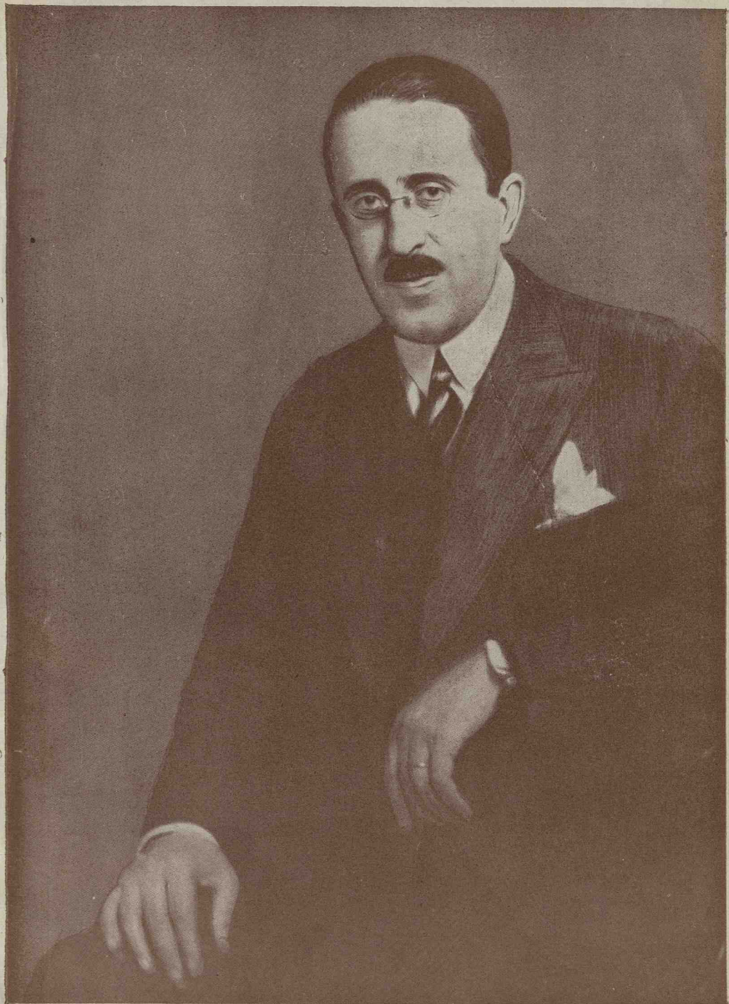
VIRGIL N. MADGEARU 27 Decembrie 1887—27 Noembrie 1940