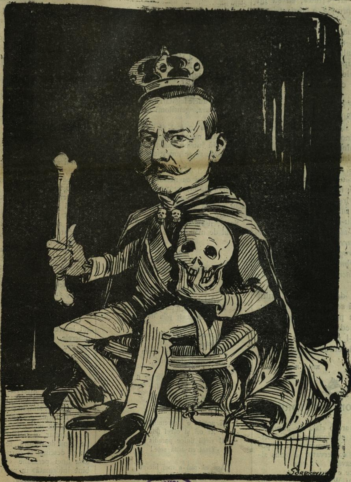
Ilustrația noastră reprezintă pe Petre I Karagheorghević după ultima sa fotografie. Noul Rege stă pe tron, avînd în mină drept coroană o hîrcă și în cealaltă un ciolan drept sceptru.