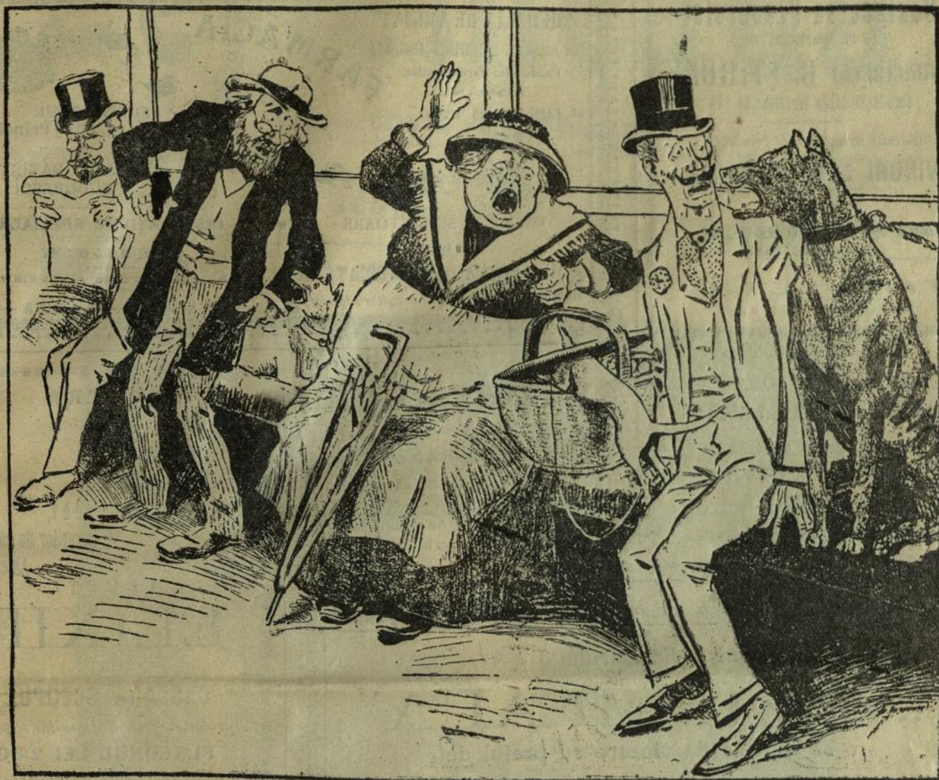
Șcena reprezintă interiorul unui vagon al trenului de plăcere (?) care a circulat în ziua de Rusalii pentru tirnosirea minăstirei Sinaia.