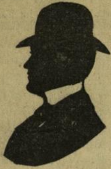
Costel Ionescu, student în drept.