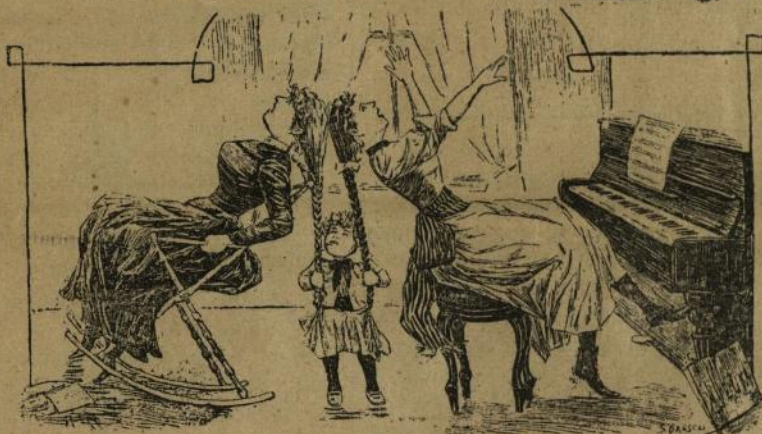
Cum se amusează micul Guliță cînd surorile sale îl plictisesc una cu muzica și alta cu cititul.

derutînd de la joc o parte din personalitatea dumatilă în favoarea mea. Dar ceea ce e curios e că modul de joc nu ți l'ai schimbat, deschiderea ți-o găseam tot mică, spre marea mea satisfacție, căci temerea de la început mi se confirma neconținut.