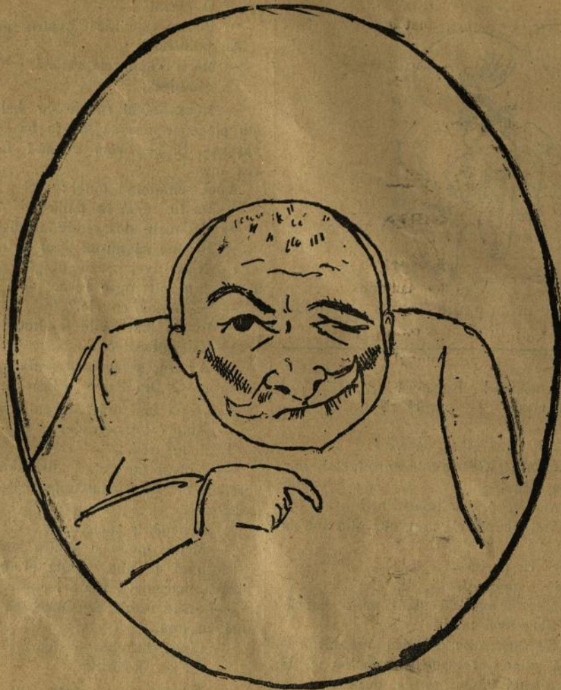
Portretul d-lui Sturdza așa cum l'a zugrăvit d. Delavrancea în discursu-i de la Dacia.