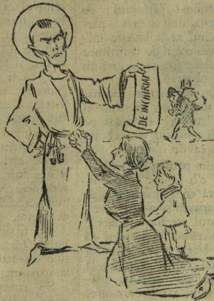
Portretul Sfântului Dumitru după ultima-i fotografie.