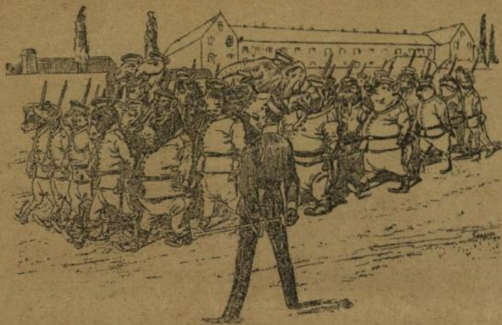
DEFILAREA ARMATEI BULGĂREȘTI