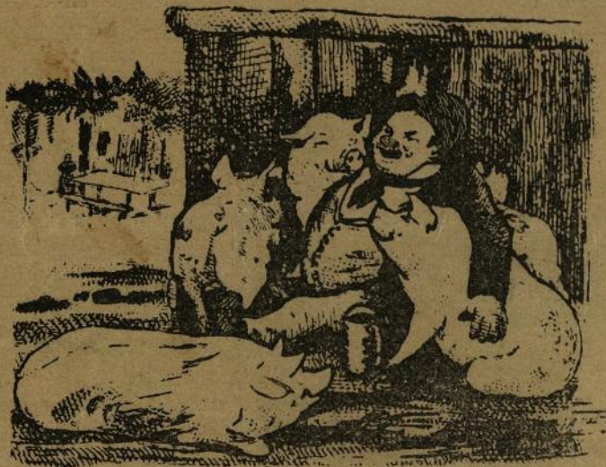
Ghicî ghicitoarea mea.