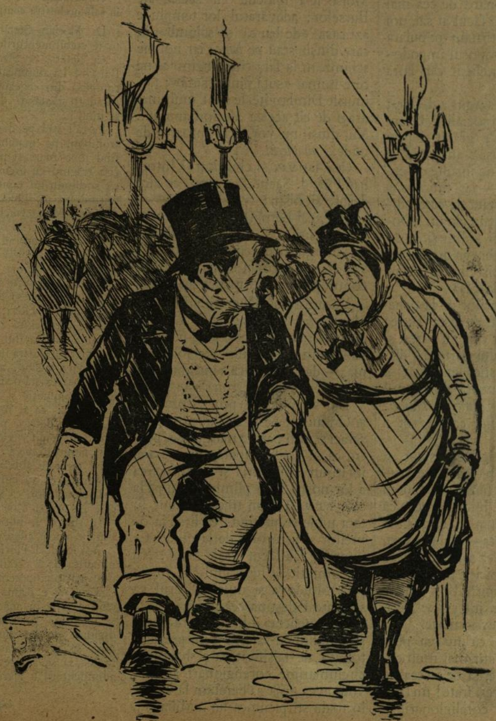
A se vedea explicația în text.