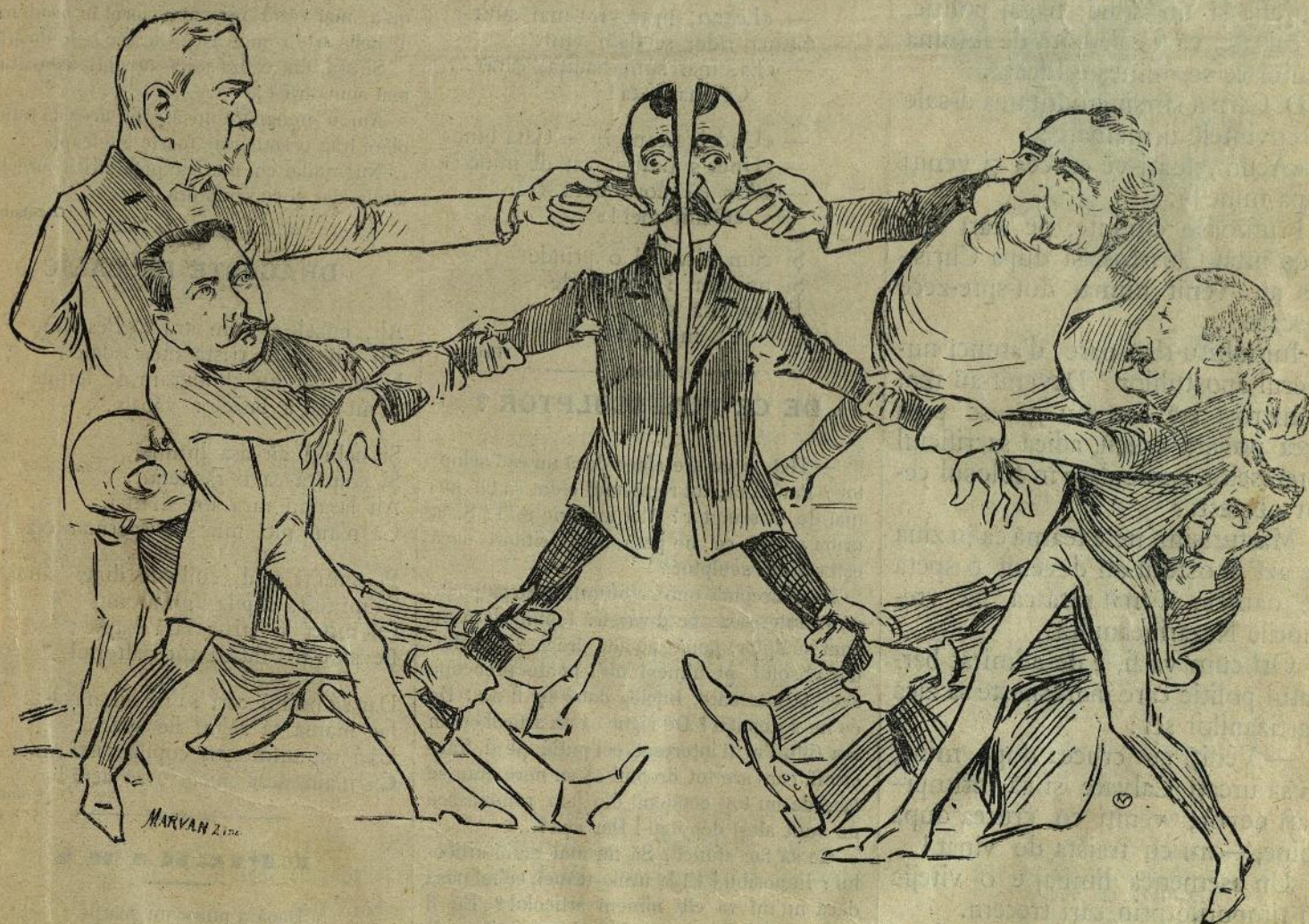
Situația delicată a unui membru devotat al partidului conservator și care își iubește și stimează de-o potrivă șefii.