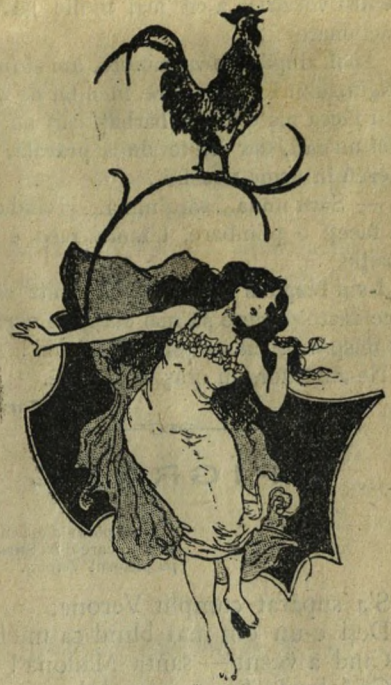
Anica cea frumoasă

Librar un om care nu știe să scrie și să