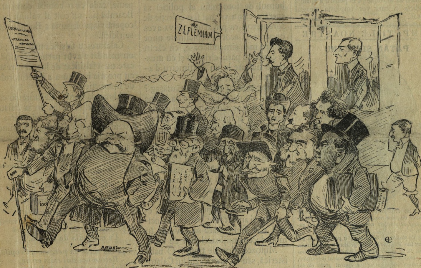
Pantheonul Român, desen de N. Petrescu.

Prețul anunțurilor, inserțiilor și reclame- lor, după invoială.