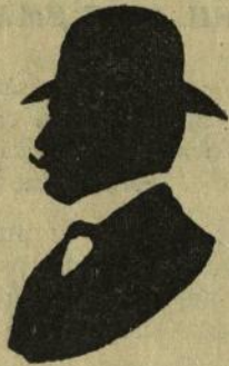
Divani, student în drept.