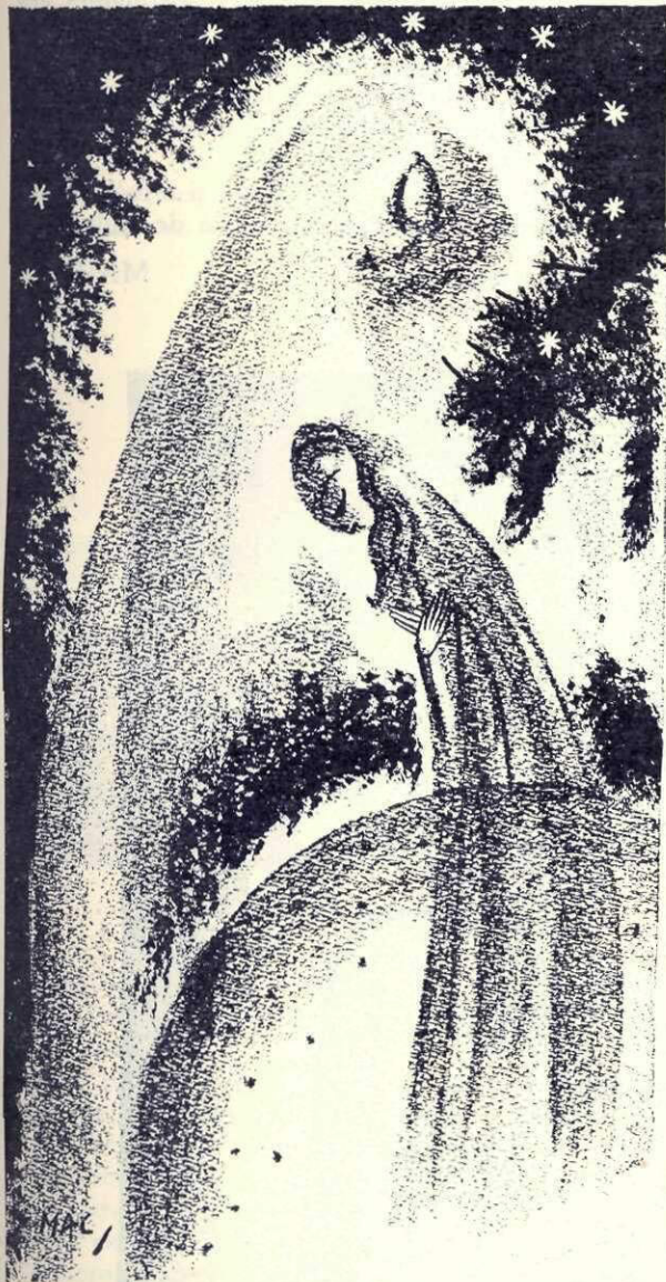
Lumina lunii îmi lucea pe mâini

Ea avea și culori și alcătuirii deosebite, dar unele fire erau cu desăvârșire slute, și vederea lor n'o puteam îndura, n'o puteam într'atât îndura încât