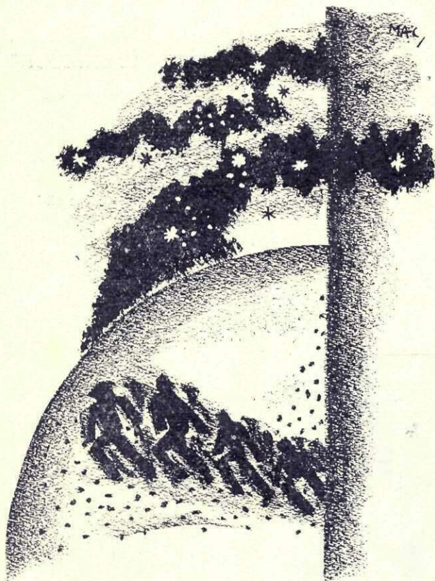
Peste câmpia aceasta trece o mulțime...

Și peste câmpia aceasta, care e lumea, trece o mulțime, bărbați, femei și copii, și cum trec văd că le cade ceva din mâini; și îmi dau seama că lucrul care le cade sunt semințe, foarte multe semințe, și bune și rele.