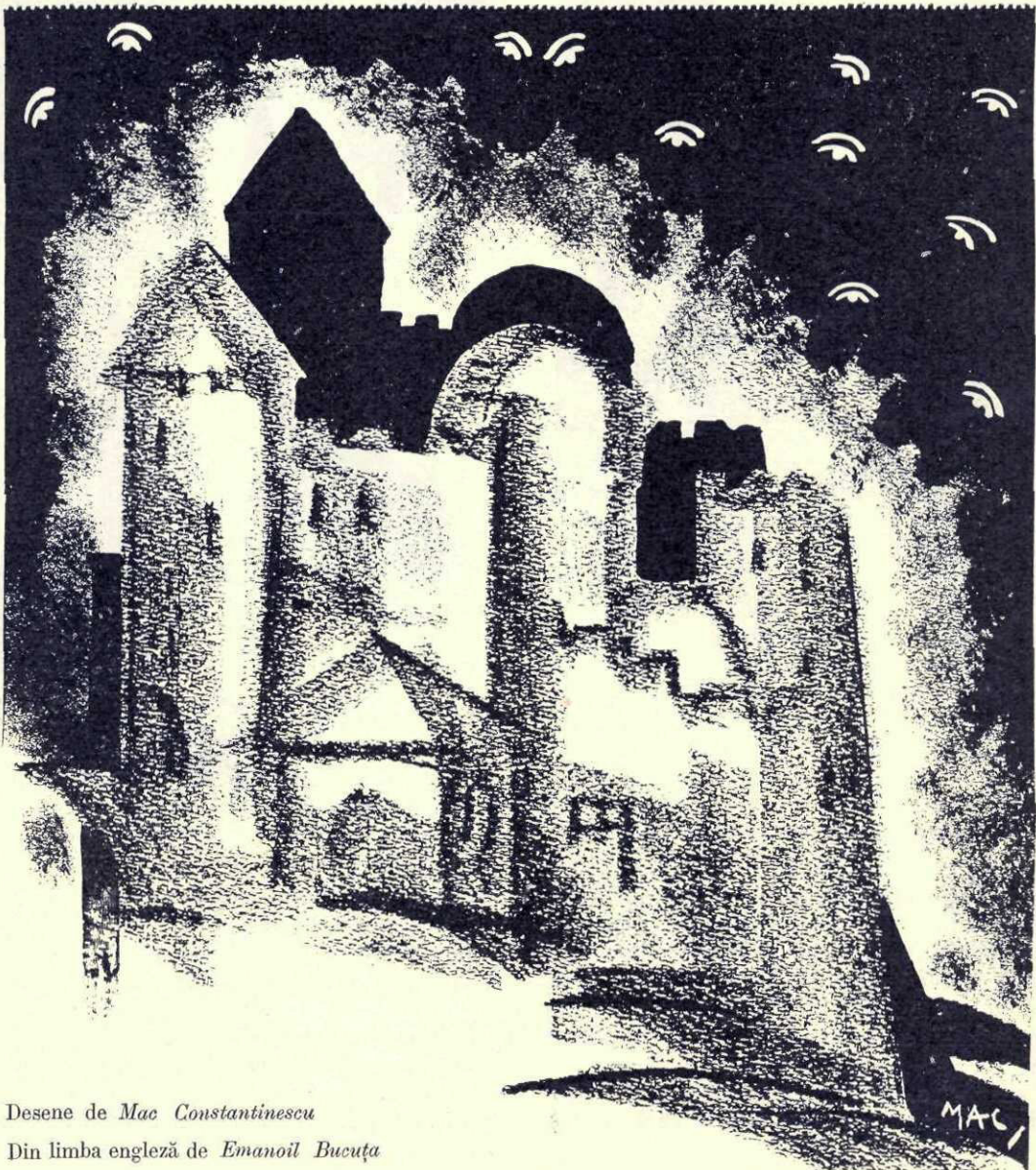
Desene de Mac Constantinescu