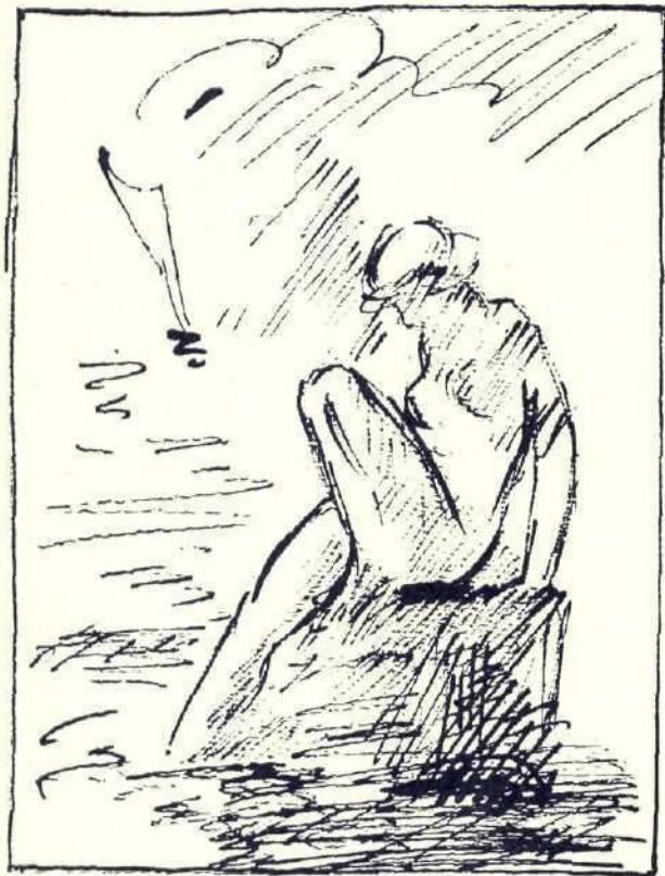
Se așază mai întâiu pe piatră și, cu mâinile rezemate la spate, întinse picioarele înainte și tulbură puțin apa

— Fotini se uita la ei, gesticula cu mâna și le spunea ceva. Dar vocea ei nu ajungea limpede până la urechile lor. Când se apropiară puțin auziră: