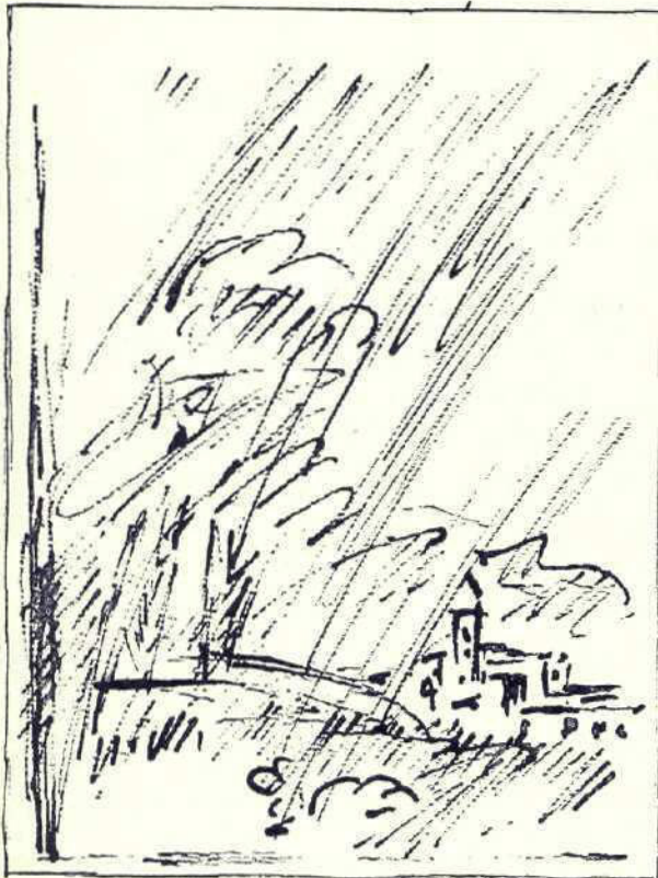
Ploaia se întetise mai mult

Făcură obișnuita lor plimbare matinală şi ajunseră până la partea opusă a moşiei. Anghelos avea poftă de mers. Drumul cel mare de țară,