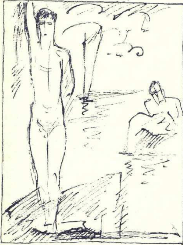
Mimis se desbrăcase

Anghelos, credincios cât putea hotărîrii, nu făcea altceva decât să ascundă de verișoară plăcerea care i-o stârneau sărutul, îmbrățișarea, mângâerea ei, și să fie atent să n'o supere pe neașteptate cu îndrăzneala pe care i-o dădea dorința arzătoare. Și la vorbele ca și în privirile lui, era cu mare băgare de seamă și măsurat. Intr'o zi chiar, când