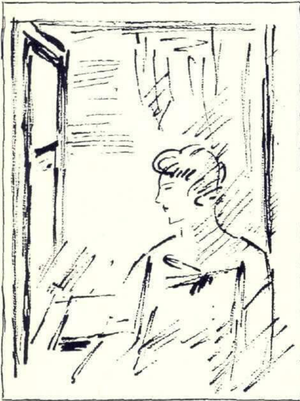
Fotini se duse să se așeze lângă fereastra deschisă

— Nu știi ce sunt bengalele? A, sunt cei mai frumoși trandafiri!... Dar numai să te uiți la ei de departe. Fiindcă n'au aproape nici un miros; iar dacă-i rupi, își pierd toată drăgălășia pe care o au așa, atârnați de rămurelele lor lungi.