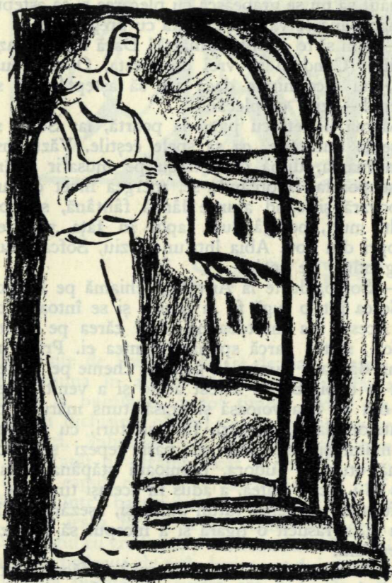
Sofca deschise poarta și așteptă

— Foarte mulțumesc, — se grăbi să mulțumească Tonet, — atât numai că eu, dacă apuc să umplu un butoiu sau două... Pe ălelalte, numai