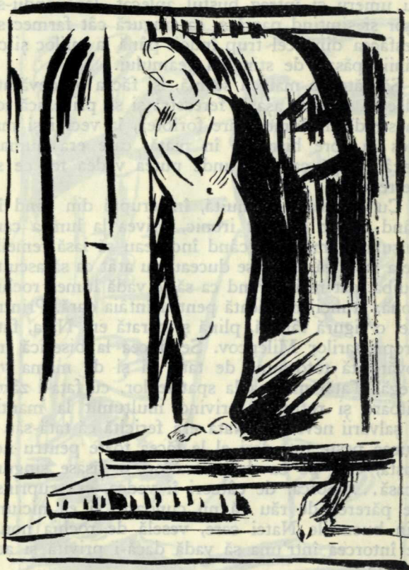
Ea stătea la poartă, rezemată puțin de pervaz

un bărbat, să se pitească după ușă și să se uite în urma lui numai după ce trecuse. Ea continua să șadă liberă și nestingherită înaintea lui, și nici sânii nu și-i ascundea, cum era obiceiul și cum ar fi făcut alta în locul ei, dacă i-ar fi avut așa de mari și de plini, aruncându-și șorțul deasupra lor, până peste cap. Sofca n'a făcut niciodată lucrul acesta. Ea stătea la poartă, rezemată puțin de pervaz, cu picioarele întinse, trecute unul peste celălalt și cu brațele încrucișate. Nestingherită în mișcări și port, nu-și ferea nici fruntea, pe care