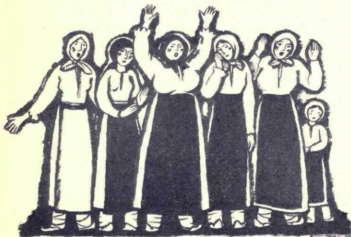
Feminae Szelistyaenses supplicant viros a rege