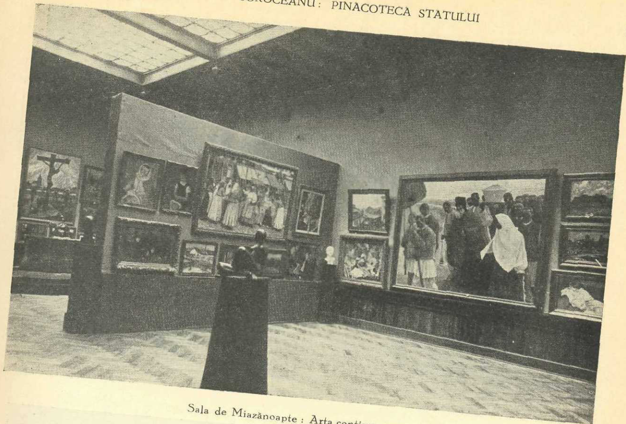
Sala de Miazănoapte : Arta contemporană