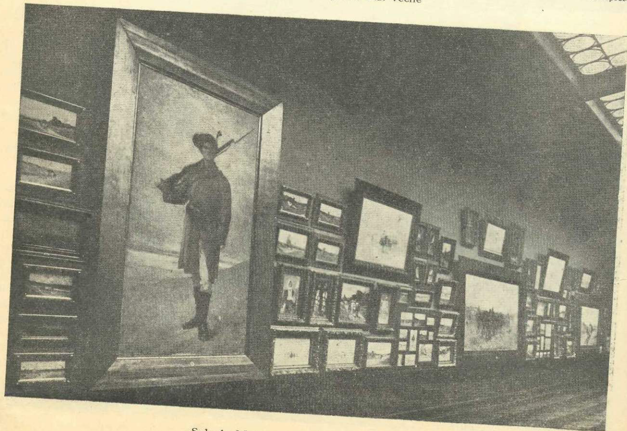
Sala de Miazănoapte : Peretele Grigorescu