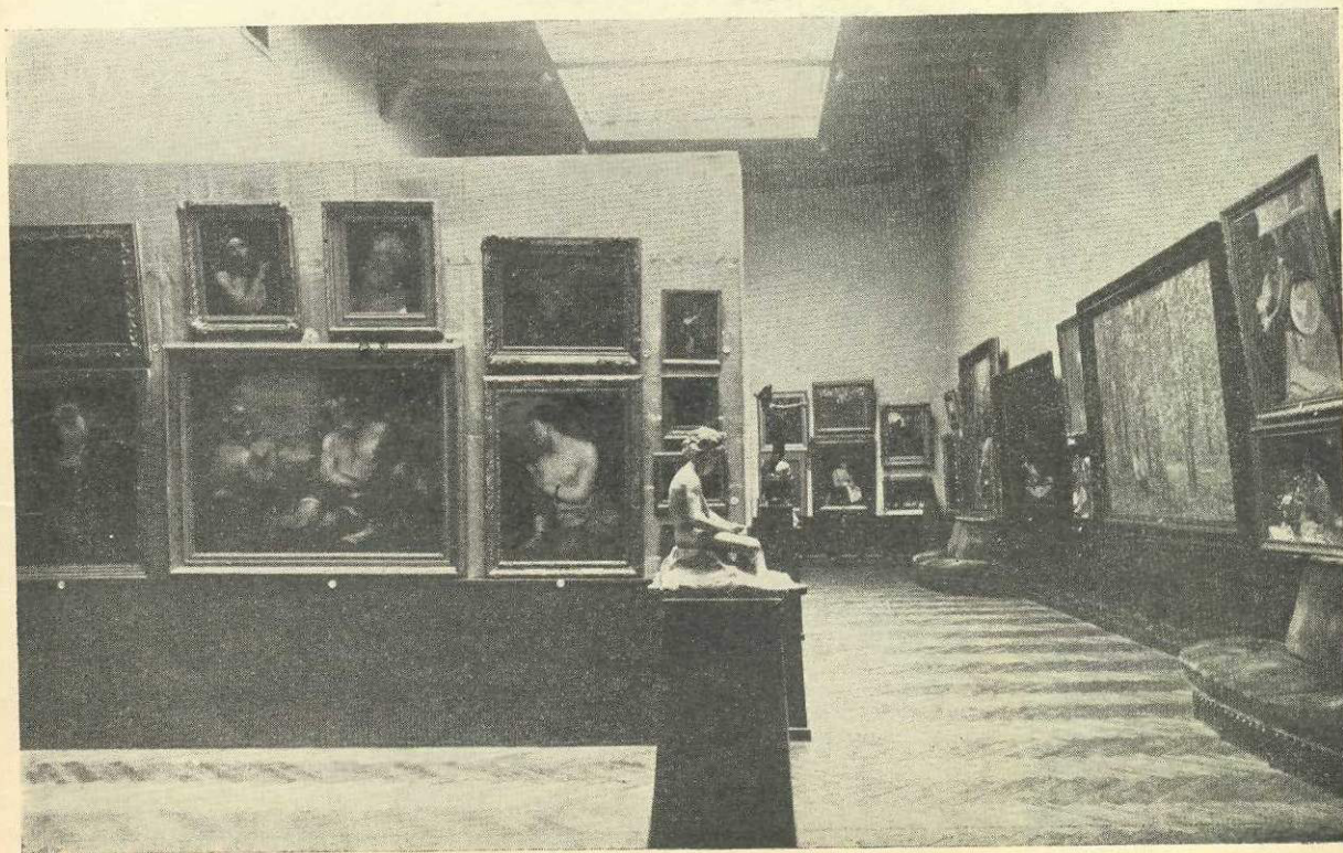
Sala coloanelor dela Ateneu