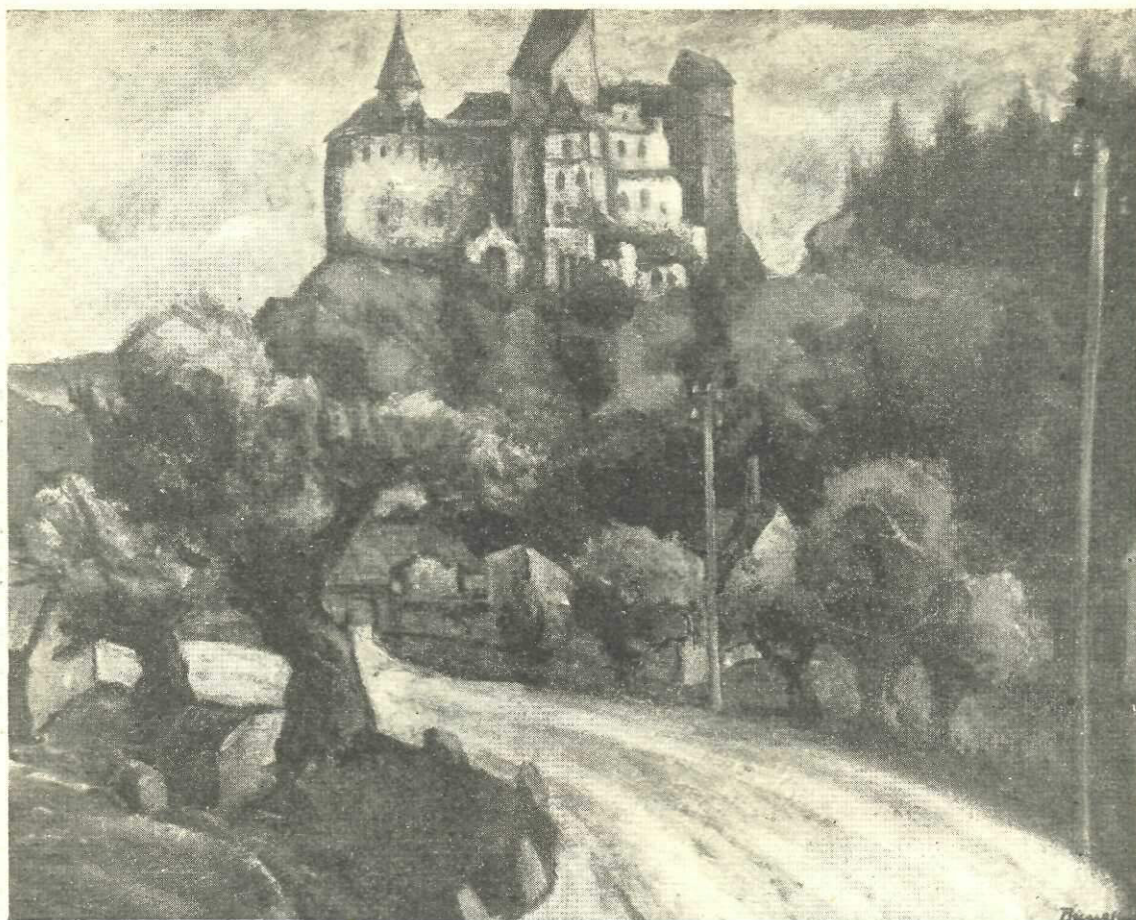
Marius Bunescu: Castelul Bran