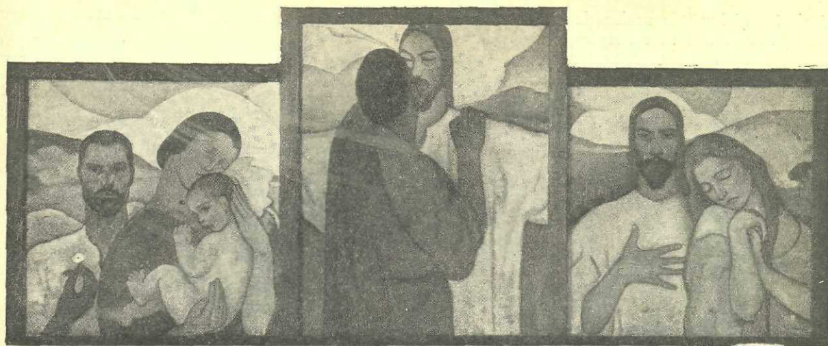
Triptic sfânt de Sabin Popp