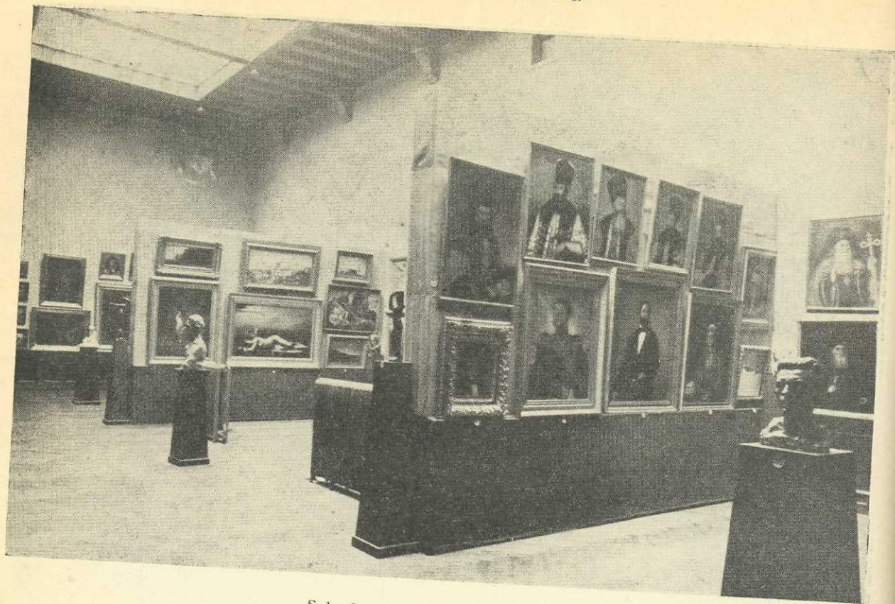
Sala de miazăzi : Arta mai veche