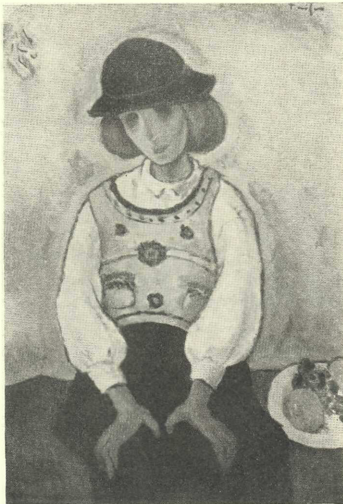
N. N. Tonitza : Oarba

În planul celor doi mari înaintași Grigorescu și Luchian, trebuie trecut continuator G. Petrașcu. Întreaga lume pentru pictorul acesta valorează în virtute de emotivitate cromatică. Nici odată nu și-a