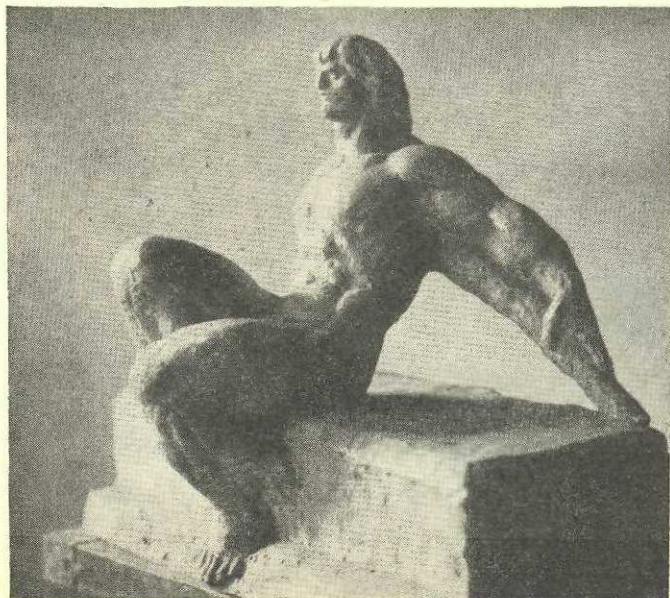
Ion Jalea : Arcaș în repaus