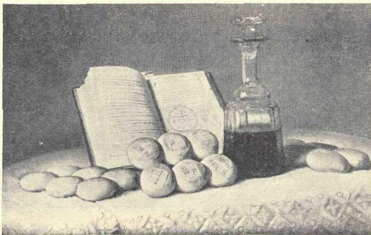
C. D. Stahi : Pentru proscomidie