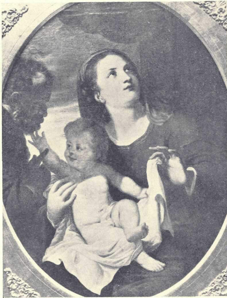
A. van Dyck : Sfânta Familie