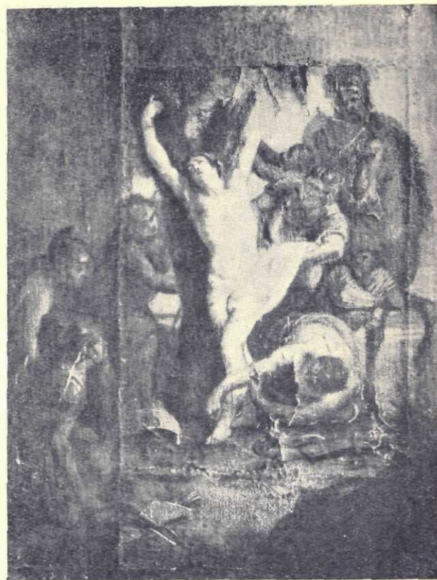
Guido Reni: Torturile Sf. Sebastian