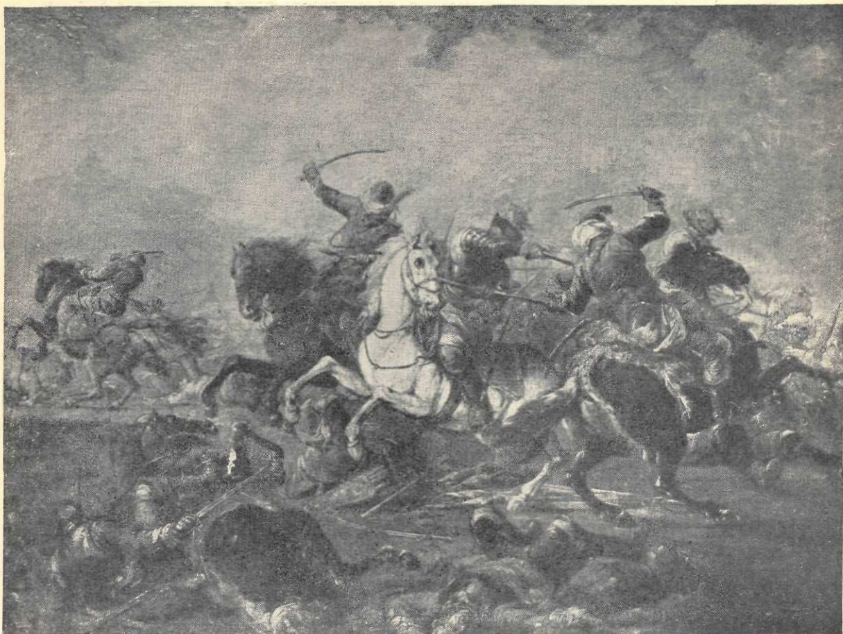
Bourguignon : Bătălia

idealizate ca și coloritul ireal dau acestui tablou o notă de distincție, în perfect acord cu subiectul.