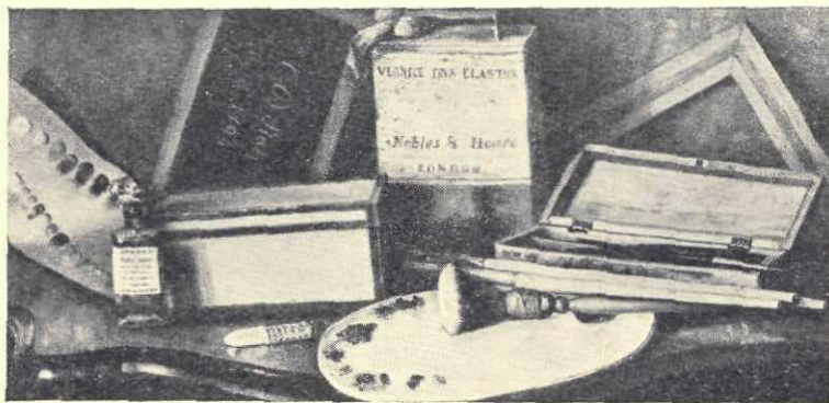
C. D. Stahi: Obiecte necesare unui pictor

Culoarea având oarecare luxurianță venețiană are și calitatea de a fi păstrată bine.