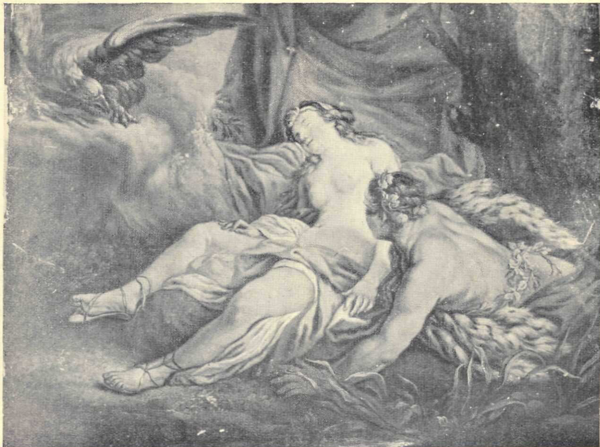
François Boucher : Venera dormind

Acum doi ani Ministerul a mai achiziționat dela familia Fotea din Iași 14 studii în desen și pictură de Asachi de pe timpul când era în Roma și se ocupa cu pictura. Tot acum doi ani, în urma unui raport al celui care scrie acest studiu, făcându-se triajul lucrărilor cumpărate după război de către Ministerul Artelor, și care se aflau depozitate prin birourile Ministerului, s'au aprobat Pinacotecii din Iași 60 de lucrări de pictori actuali, (dintre care încă 8 Grigorești din ultima epocă, proveniți din Pinacoteca Statului de la Ateneu). Cu această ocazie s'a putut constata cât de slab sunt reprezentații artiștii români în co-