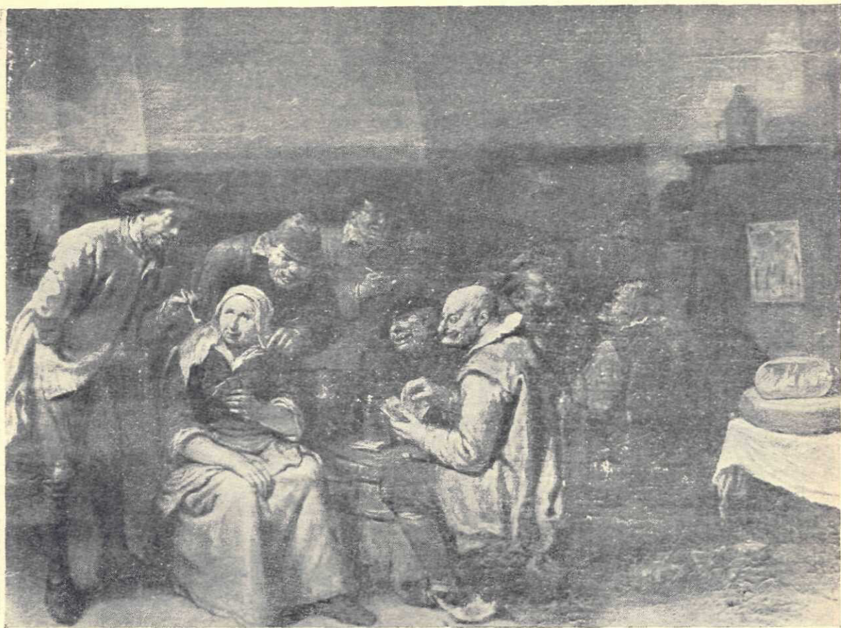
Heemskerck Egbert: O cafea flamandă

comisia a ținut în seamă scopul Statului care vrea să asigure, pentru o sumă care să fie cât mai ușor de suportat.