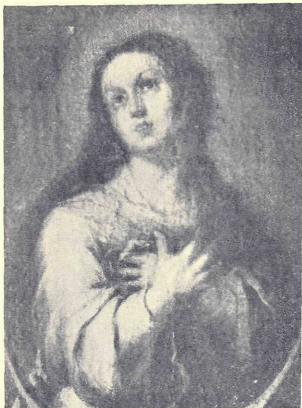
Murillo: Fecioara Maria

Astfel, cu tablourile lui S. Vârnav, care stătuseră păstrate de Academia Mihăileană timp de 12 ani, împreună cu o altă serie de lucrări găsite aci, se înființează Muzeul Național de pictură cu titlatura de mai târziu „Pinacoteca Națională din Iași” și care se inaugură oficial la 26 Octombrie (Sf. Dumitru) 1860 sub Domnia și prezența lui Vodă Cuza, în același timp cu școala de Belle-Arte și cu Universitatea din Iași.