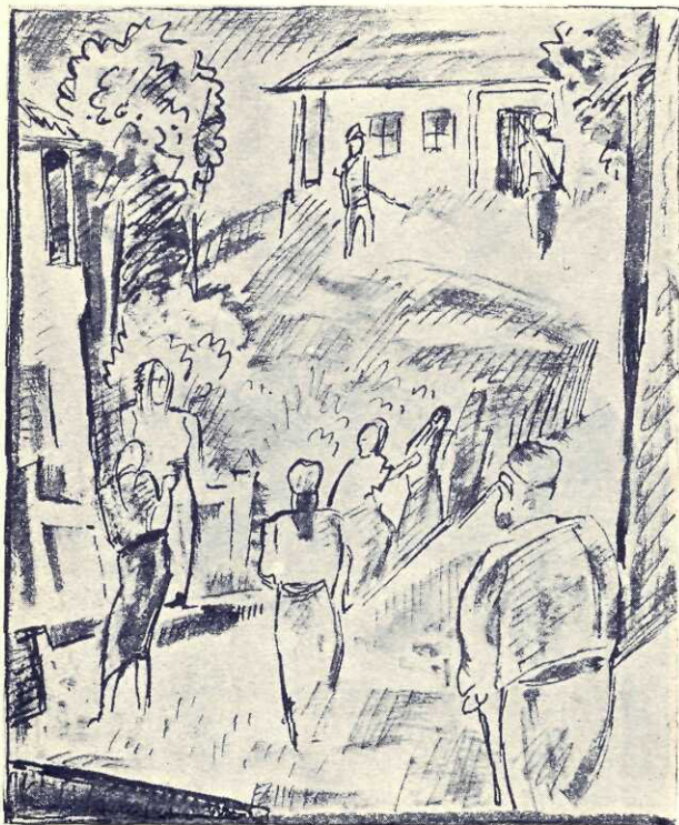
Sus pe deal se zăreasa Albenede unde urma sa fie scoasă

Se ridică sa pièce. Mișcat, mocanul porni și el să-l însoțească și sa vadă și fata.