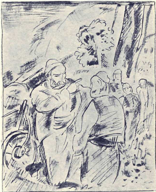
Mo? Şterie privea spre cei doi copaci singurateci dela miazăzi

— Iartă, Şterie ciorbagi. None ducem. Am sa plec departe, până la Mare. Dacă cumva si acolo