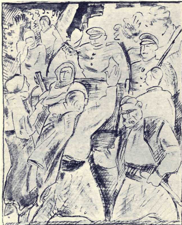
Dar Neagul își deschise drum

pe Albena, dar când au văzut-o din nou de aproape, totuși își opriră râsuflarea. Albena era aceeași Albena, numai că nu râdea, ochii nu-i mai jucau ca mai înainte, ci aplecați sub sprâncenele subțiri, priveau în jos. Purta rochie de postav și scurteica cupiei de vulpe pe margini. Avea mâinile în cruce