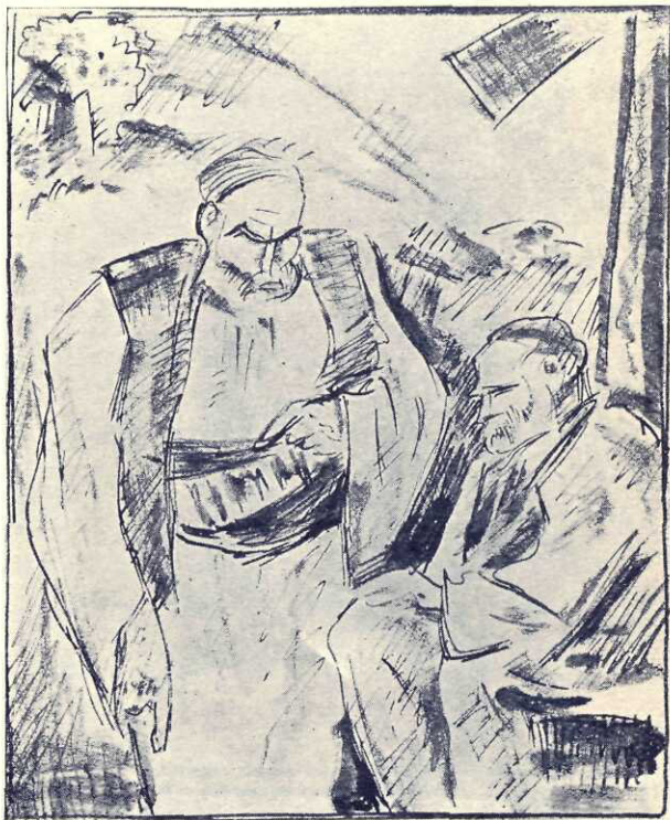
El se apropie de Mos Șterie și începu a vorbi tare

Intr'o noapte, o voce tinerească, aproape de copil, strigăîaintea morii și mos Șterie ieși. În