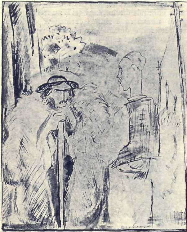
Dar mocanul repede îl cântări și și dădu seama

Era înalt, o namilă de om; dar câ era sârac și parcă născut sarac— și asta se vedea. Cămașa-i era numai petice, mare și nepriceput cusute, brăul sdrențuit, nădragii de asemenea. Era desculț. Alt-