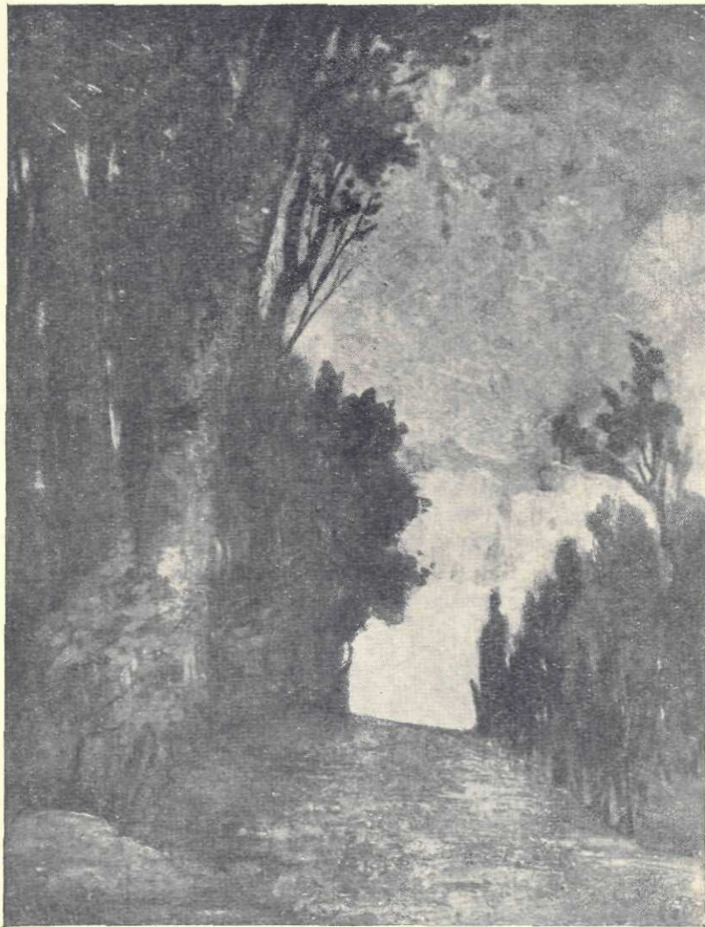
Gustave Courbet : Drumul

mătase. Artistul izbuteste să ne dea și nouă bucuria lui, din care a ieșit tabloul. Subiectul, de plin aer, pe care-l avea gata, suferise de observațiile lui Courbet. Trebuia schimbat și nu mai era când. Făgăduise o lucrare însă la salon. Vremea trecera, deschiderea se apropiase, era a doua zi. Viața e de multe ori, întunecată, cafeenie, cu note stinse, cum e toată această odaie, pe care o străbate deodată dela un capăt la altul, ca un strigăt de bucurie și o solie de speranță, o femeie măreață, într'o rochie de mătase verde vărgată. Stă o clipă în raza minții și întoarce capul cu mânușa ridicată, la care își încheie cel din urmă năsturel. A și plecat pe jumătate, e de