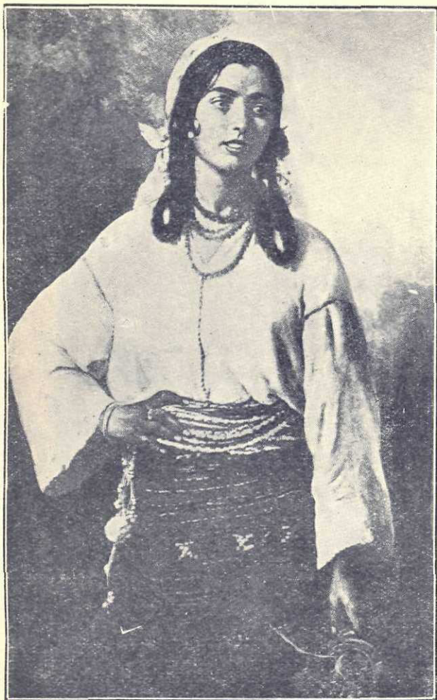
Th. Aman : Țigancă