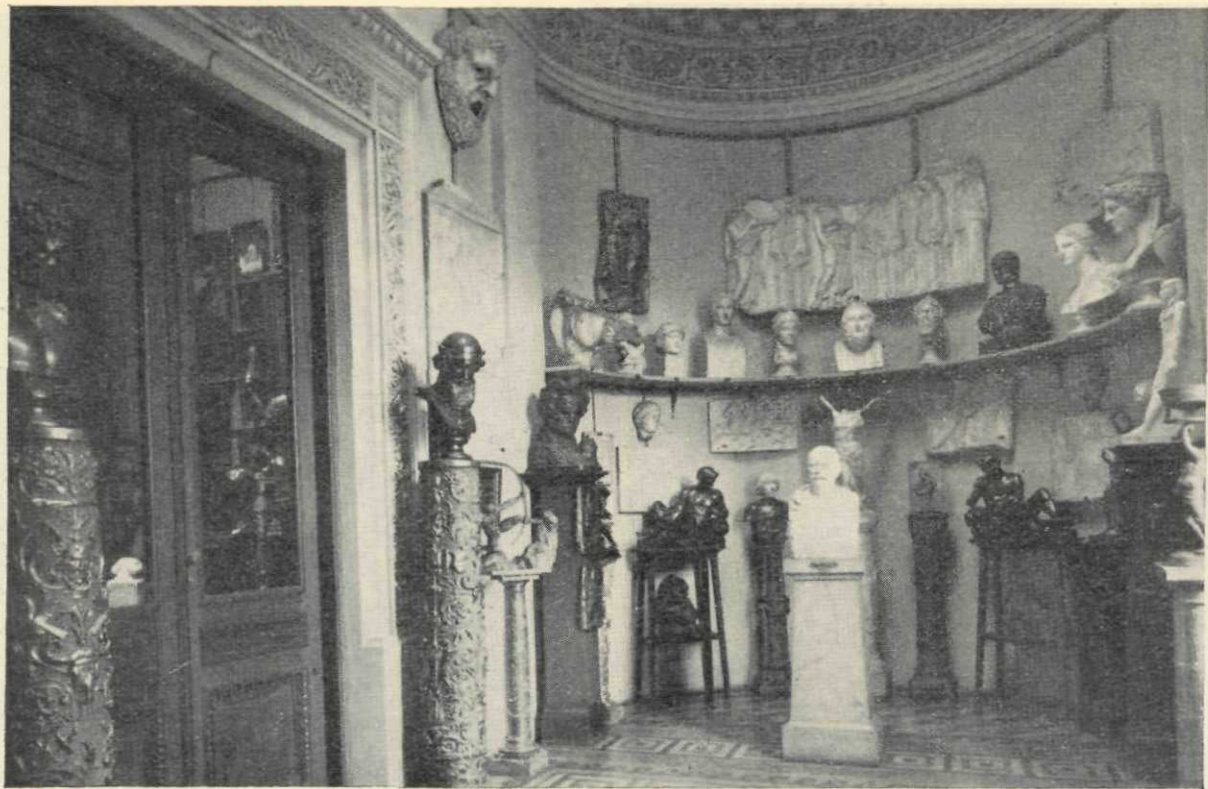
Sala sculpturii (cu vedere spre sala românească)