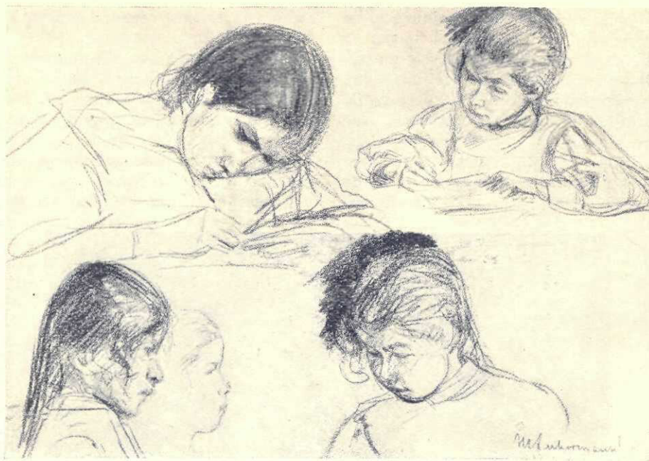
Max Liebermann: Copii

pentru întâia oară și râsul ploii de lumină, prinse pe creștet, în palme, pe trupul desgolit. O poartă s'a deschis, pe care viața și-arată înfrângerile și mersul după legi de aramă. Variația e o părere. Din pensulă picură fără voe o lume, omenească și cosmică, tipică. Un călător încotoșmănat, în bătaia răcorii unei ferestre lăsate, dela un tren purtat de o putere nevăzută peste un câmp, sau un grup desnădăjduit de paiețe, care ar vrea să fie vesele, în dimineața sau seara începătoare sau în soarele unui circ în aer liber, sunt aceleași intrupări, înșelare a ochiului. Besnard, își rotește femeia lui spaniolă, roșie și încețoșată de iuțeală, Sisley își înalță catedralele, aproape de aur topit, ca o brumă care nu curge încă, Raffaelli deschide, argintie și frământată, piața din Antibes, cu liniștea din întâiul plan a plopilor de o sută de ani și a vechilor scări și parmalăcuri și cu liniștea de pretutindeni a atmosferei cu tonuri moi și alburii, Courbet duce pe drumul lui, cu jocul dintre cele două laturi de umbră, scoasă ca din țevi ine-