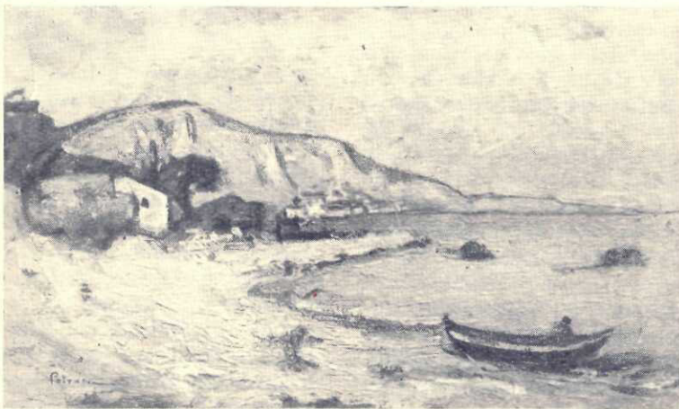
G. Petrașcu : Balcic