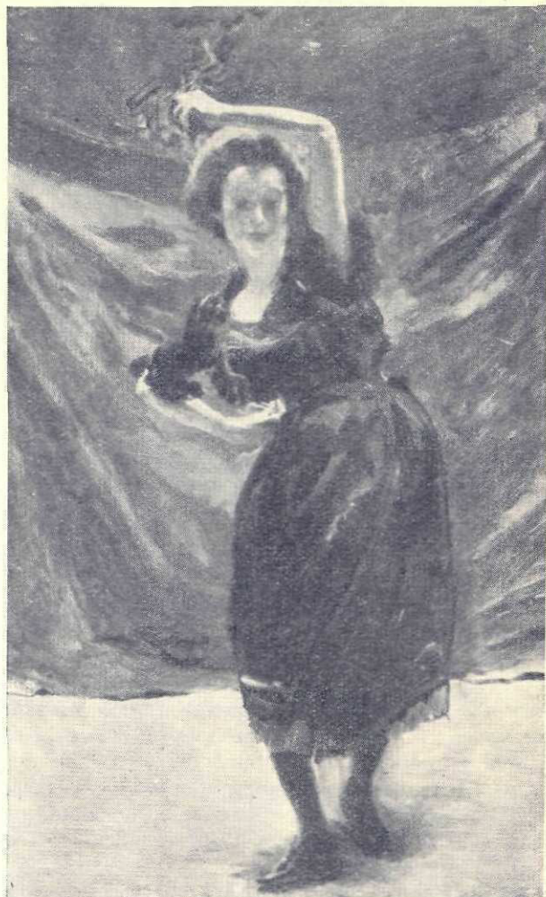
Albert Besnard : Dansatoare spaniolă