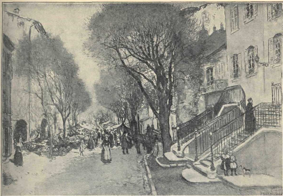
Jean Fr. Raffaelli : Antibes