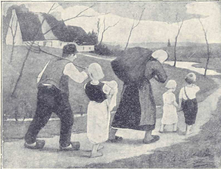
Eug. Laermans: Intorcerea dela câmp

Întâia sală, de formă absidială, cu două sânnuri, e închinată sculpturii. Deoparte e arta veche și păgână și de alta arta mai nouă și creștină. E singura parte propriu zis istorică. Bucățile moderne, aici, sunt puține și fără legătură cu celelalte, fie și numai de aceea că unele sunt originale, pe când cele de al doilea sunt copii sau preluări. Sculptura a năvălit, și la dreptul vorbind apare mai caracteristică în alte săli. Dacă se socotește sala sculpturii un vestibul interior, bronzul și piatra întâmpină încă din vestibulul exterior dela intrare, sunt prezente în vestibulul exte-