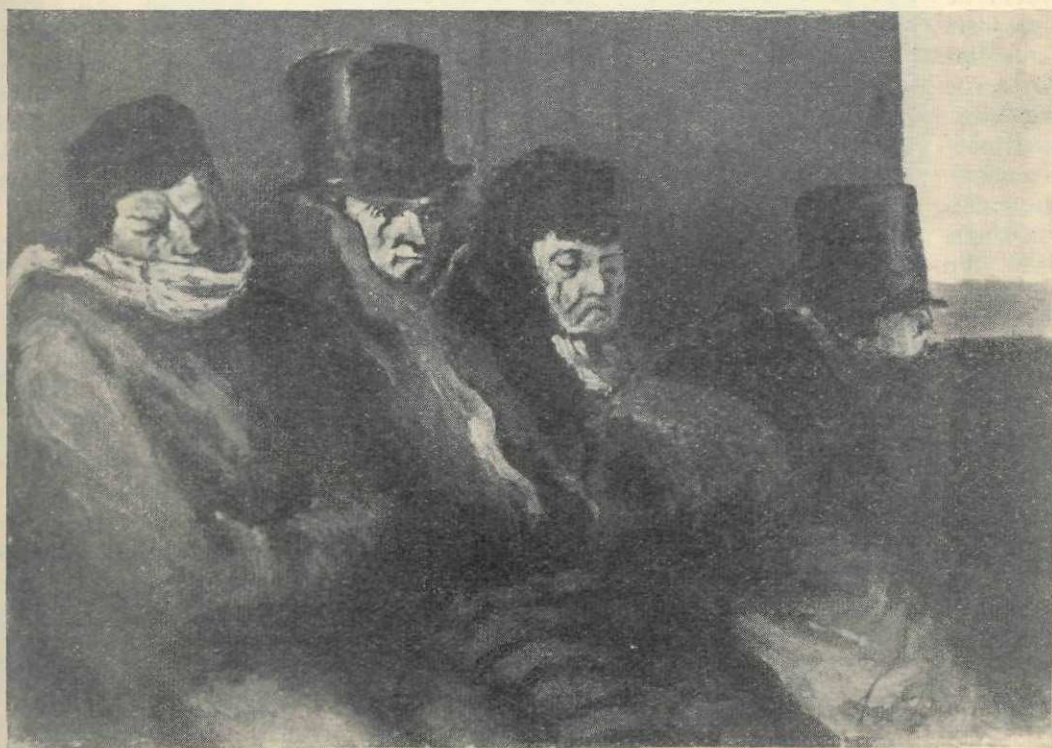
Honoré Daumier : Compartimentul de clasa a III-a