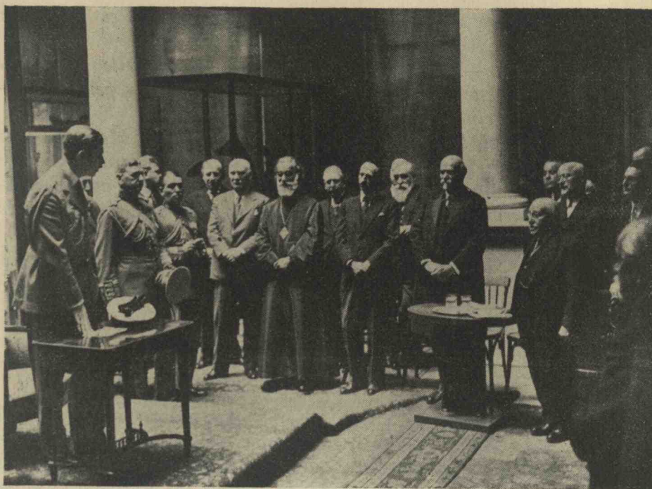
M. S. Regele Carol II rostind cuvântarea Sa în ședința solemnă dela 23 Mai 1933.