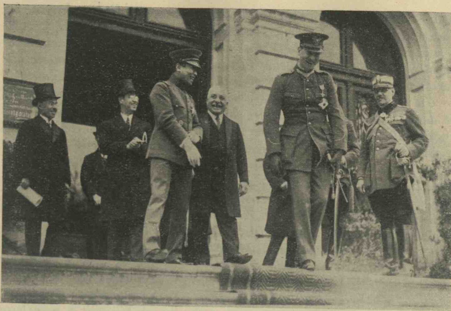
Vizita la Muzeu a A. S. Imp. Principele Higashi Kuni al Japoniei însoțit de A. S. R. Principele Carol la 4 Aprilie 1924.