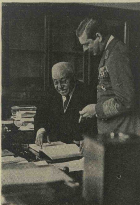
M. S. Regele în Laboratorul Directorului

Pilda și însuflețirea Maiestății Voastre ne vor face eforturile și aci, ca și în toate direcțiile culturii naționale, mai ușoare și mai rodnice.