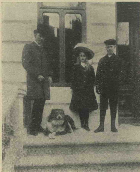
A. S. R. Principele Carol și Principesa Elisabeta la vechiul Muzeu din str. Polonă ( 3 Iunie 1904 ).

Simt o adâncă mulțumire sufletească, că îmi este îngăduit astăzi — când și eu însumi încheiu 40 de ani de muncă la crearea și organizarea acestei instituții — să am marea fericire de a prezenta Darea de seamă a activității mele înaintea Urmașului marilor Regi cari au dat poporului nostru independența și unitatea națională. Înaintea aceluia energic Rege pe care soarta l-a predestinat de a consolida, prin arma cea mai nobilă, a culturii, opera iluștrilor Săi înaintași și de a îndruma apoi, pe această cale, poporul român la îndeplinirea misiunii sale istorice, care este: de a crea, prin desfășurarea ge-