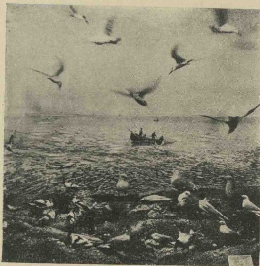
Una din Dioramele Muzeului (pe malul Mării Negre, la Portița).