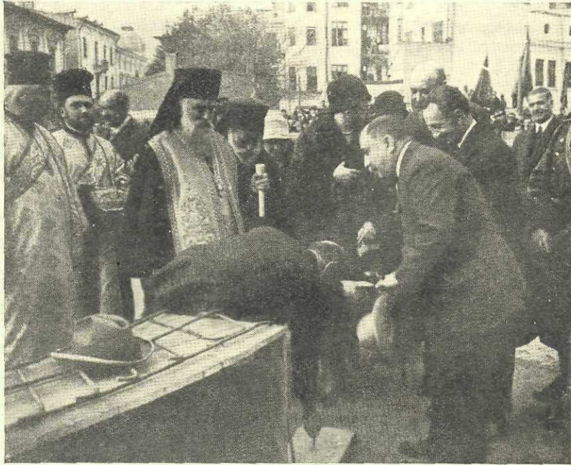
Punerea pietrei de temelie la Palatul Ligii la 8 Noiembrie 1926