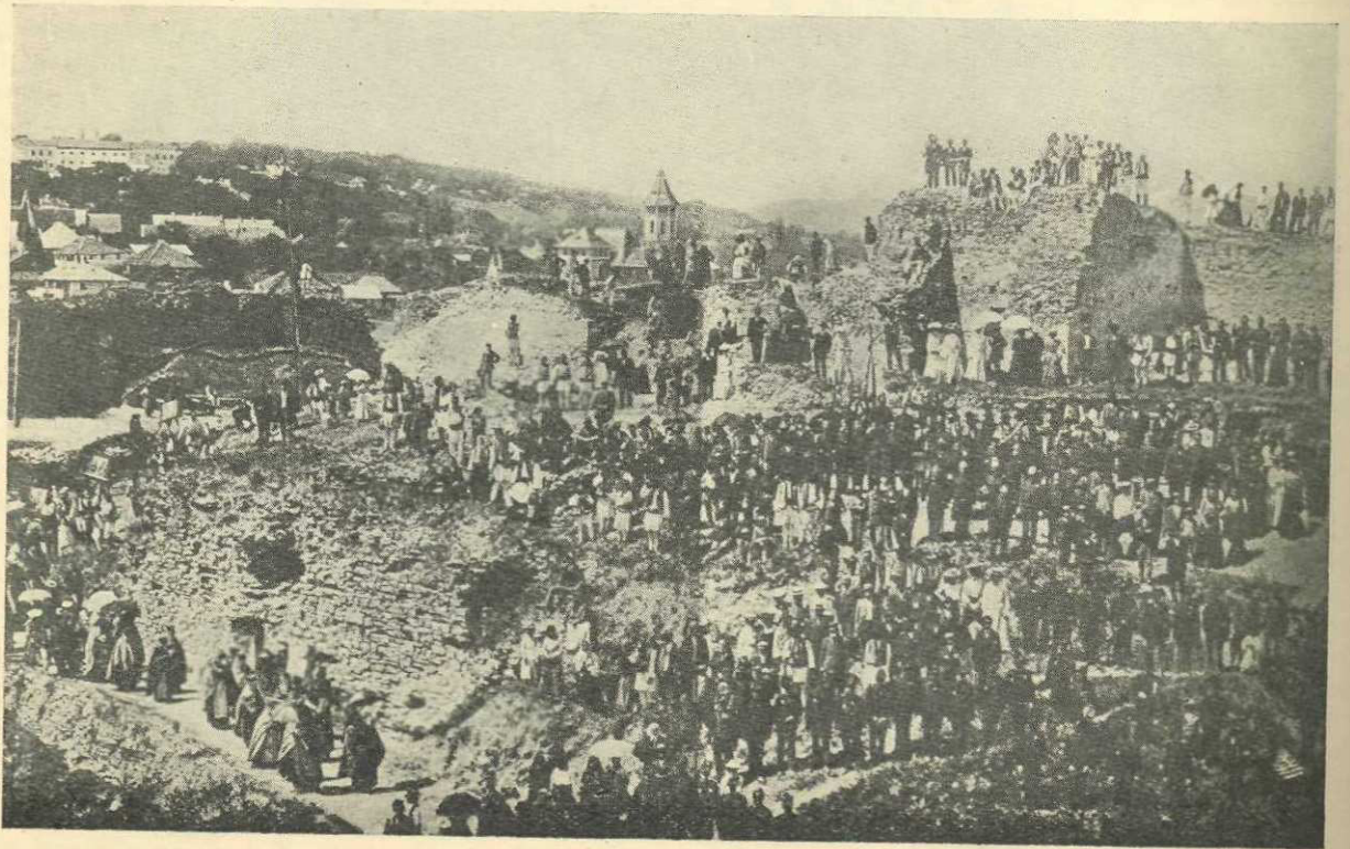
Serbarea a 400 de ani de la moartea lui Ștefan cel Mare, la Suceava, la 2 Iulie 1904