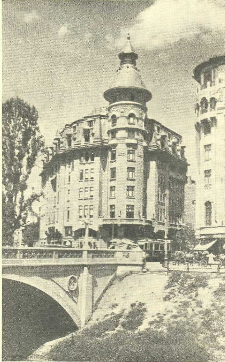
Palatul Ligii Culturale

ric recunoscut, de o caldă simțire pentru nație, de mult curaj în vicisitudinile politice, de o francheță care nu cruța mijloacele și de o reală și complectă desinteresare în viața publică. Avea un nume pe care l-a purtat unul din boierii lui Mihai Viteazul și, neavând fiu, visa ca ginerele său să fie prefect în Alba Iulia. Petre Grădișteanu rămăsese însă omul generației sale, și pentru o nouă generație