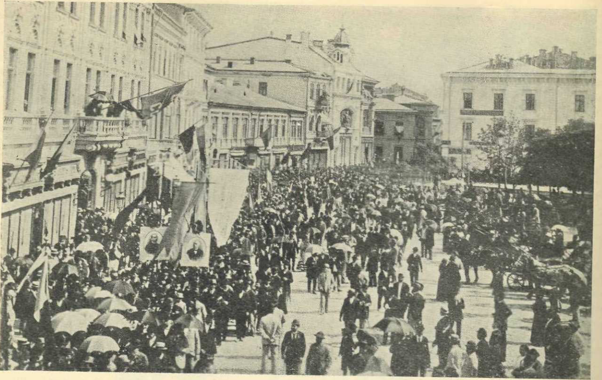
Manifestația studenților pentru Românii din Transilvania în București la 14 Iunie 1892