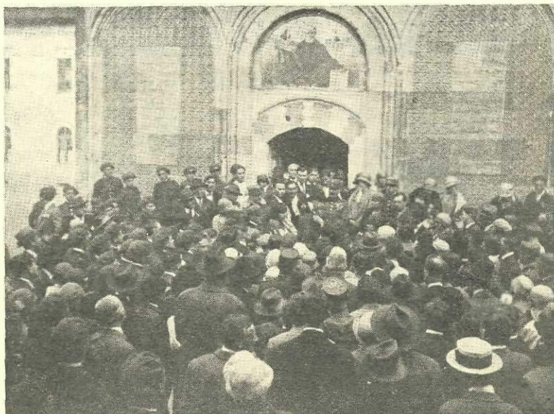
Liga la Mănăstirea Dealului