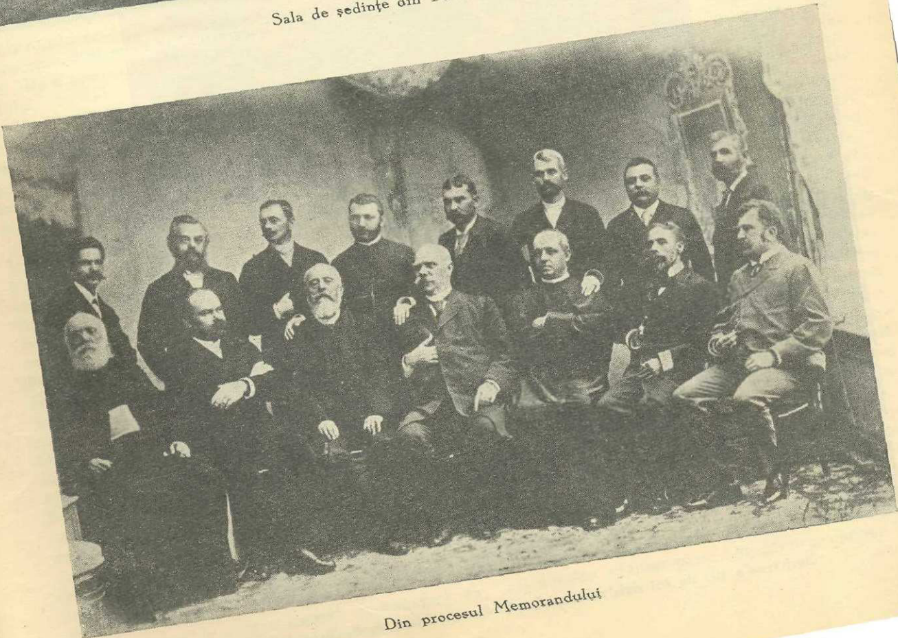
Din procesul Memorandului