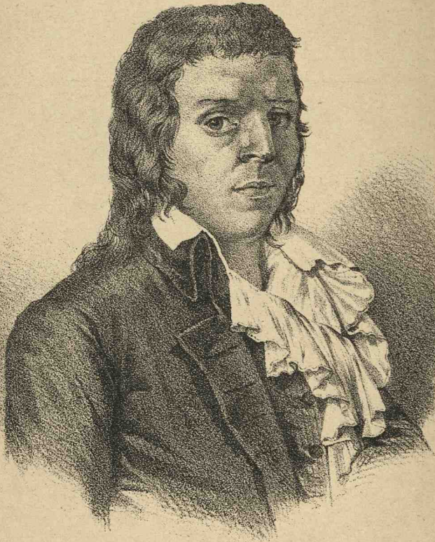
François-Noël (Gracchus) BABEUF