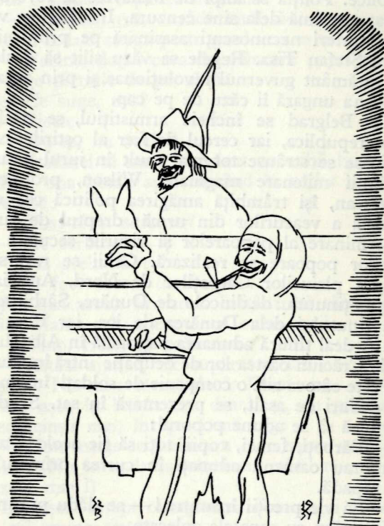
Țiganul cărămidar ducea un pian de furat încărcat pe căruța lui hodorogită

Oamenii se rușinară și se împrăștiară în tăcere la casele lor.