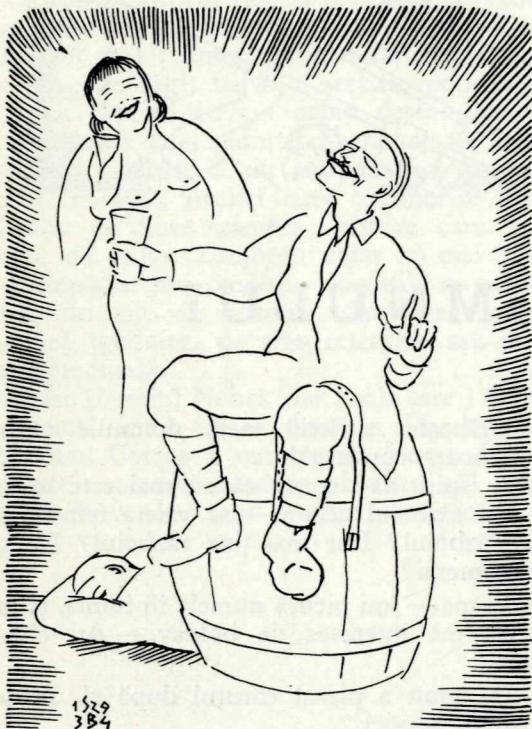
De pe nevestele ușuratece rupeau hainele

— Fie, ce va fi, numai să se sfârșească! — blestemau oamenii. Pe stradă nu se mai jucau copii,