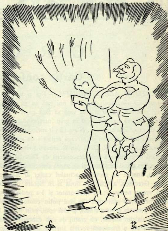
Deoparte un haiduc în gală, de cealaltă parte un preot, care se roagă

— N'aveți pentru ce, părinte. Mă bucur că v'am putut ajuta.