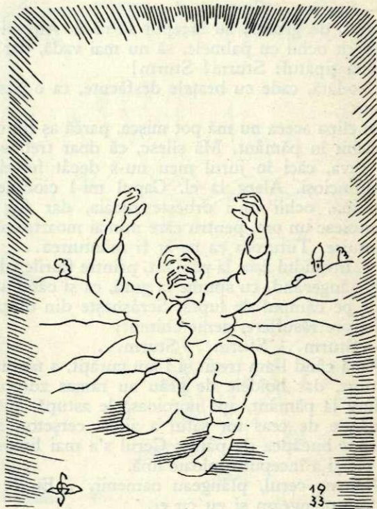
În care front se afla Domnul ?

Atunci invalidul se pleacă la urechea mea și șoptește nervos: