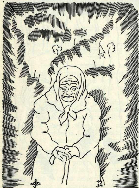
Mama lui îmi pândește fiecare mișcare a obrazului