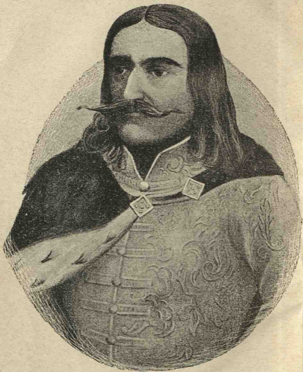
Iancu de Hunyad