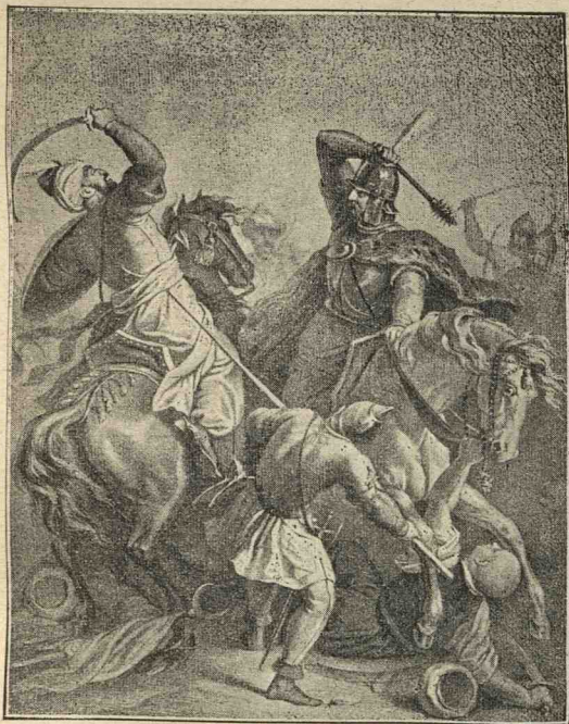
lancu de Hunyad în lupta dela Varna