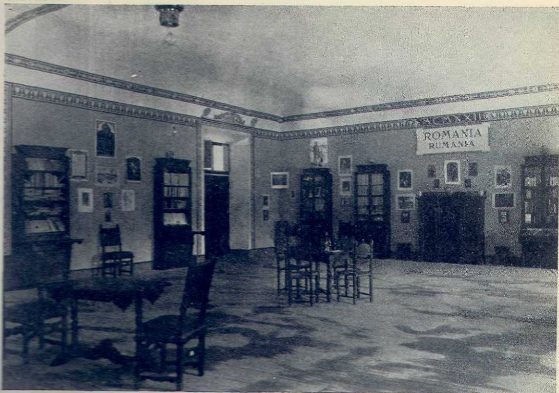
Secția Românească în Expoziția internațională a cărții dela Florența Anul I