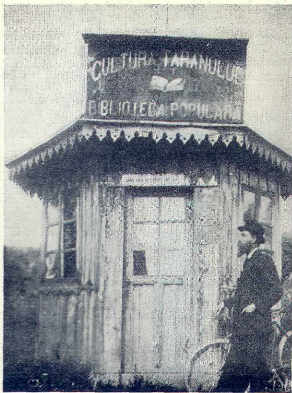
O bibliotecă populară a Fundației

de posesie, revendicări, acte de vânzare făcute între părinți și copii etc.