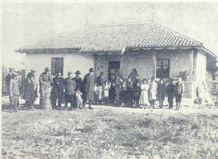
In misiune culturală la Vulturești, colonie militară de lângă Balcic