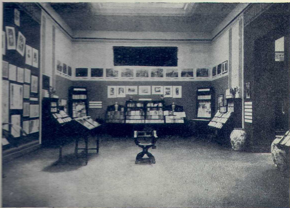
Secția Românească în Expoziția internațională a cărții dela Florența Anul II