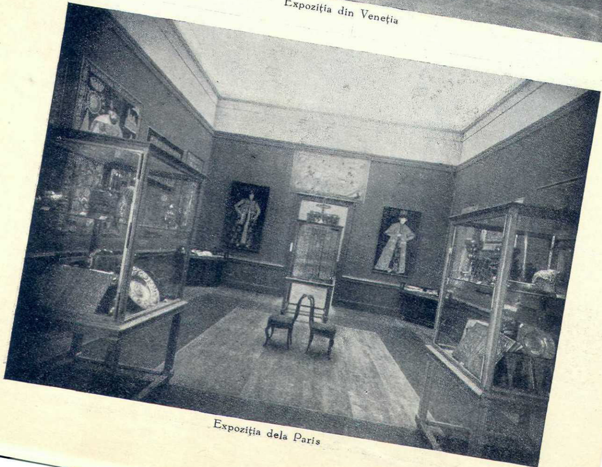
Expoziția dela Paris