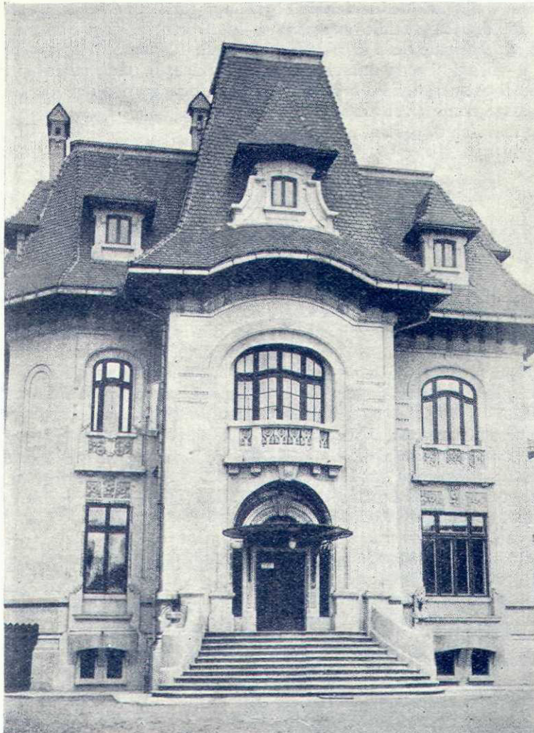
Sediul Fundației Culturale Regele Mihai din București

Intemeetorul Fundației a peregrinat el însuși însuflețind cele mai frumoase așezări ale țării.