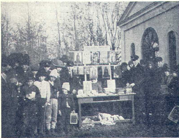
Desfacere de icoane și cărți înaintea unei biserici de sat, organizată de Fundație

„Cele mai frumoase câștiguri sociale, votul ob-