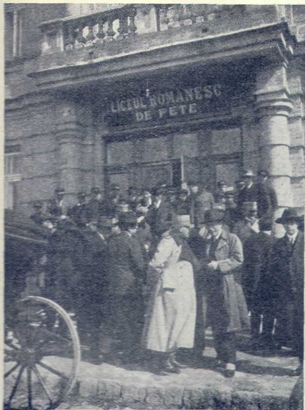
In misiune culturală la Ismail