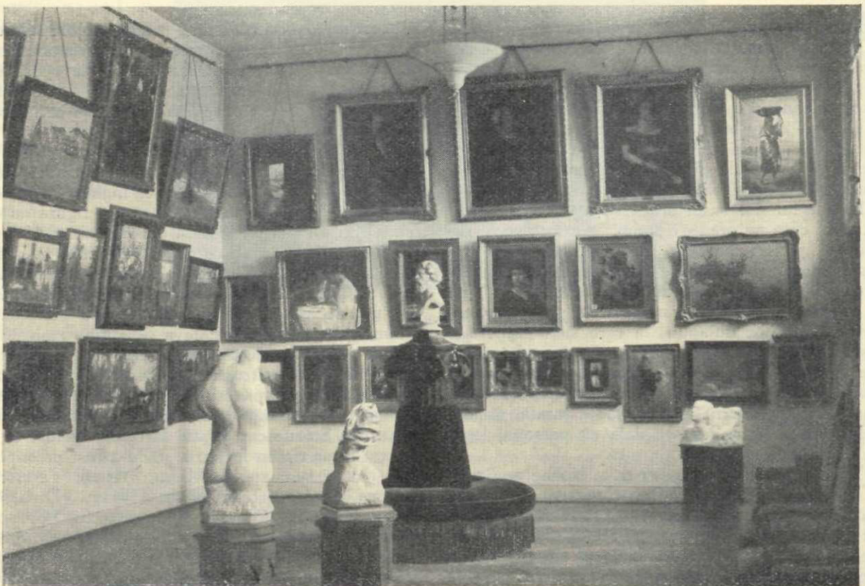
A doua sală a Pinacotecii: In fund lucrări de Aman