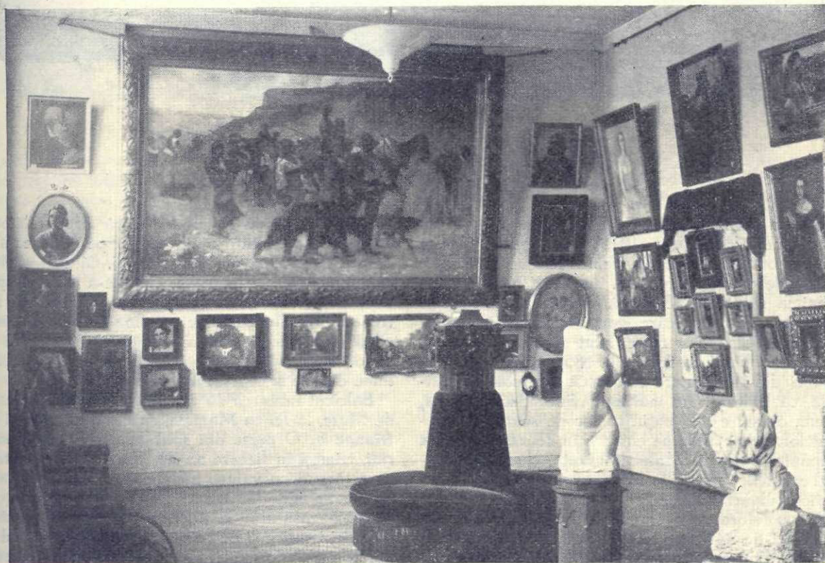
A doua sală a Pinacotecii: În fund tabloul lui Stoenescu