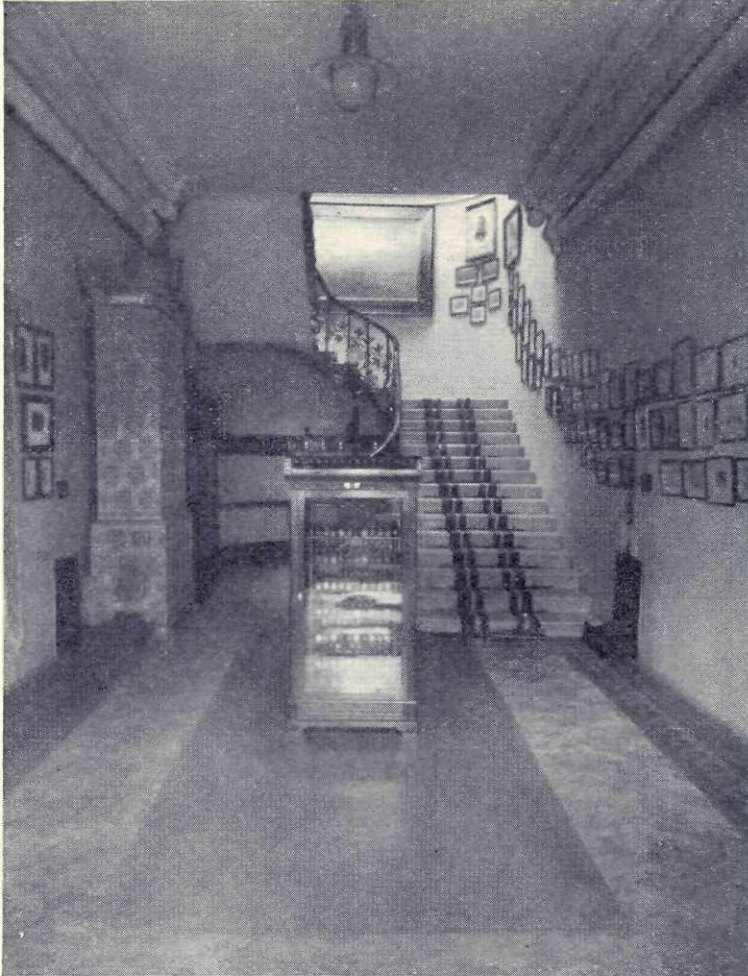
Sala de jos cu scara care duce la etaj

În colecțiile bibliotecii figurează și oarecare documente — cum bunăoară acelea ale familiei Aman.