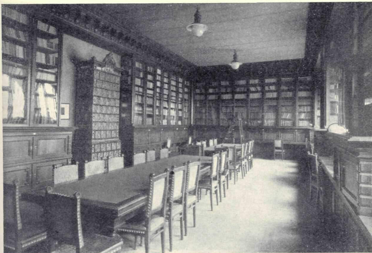
Sala de lectură a bibliotecii

Printr'o dispoziție pe care o luase fostul primar, d-l C. Potârcă, urma ca în cel mai scurt timp să se depună materialul arhivalic, sub formă de împrumut numai, la Arhivele Statului, secția Craiova, proprietatea rămânând a Fundației Aman.