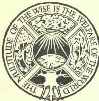
Emblema Asociației internaționale pentru educația poporului