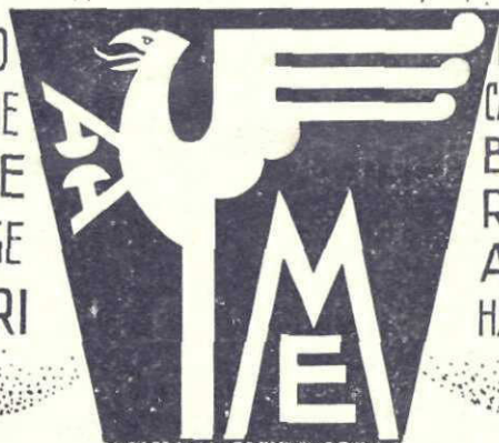
FOTO-LITO METALOGRAFIE DESENE FOTOMONTAGE RETUȘURI

CĂRȚI DIDACTICE CĂRȚI ȘTIINȚIFICE : BROȘURI REVISTE ACȚIUNI HÂRTII DE VALOARE