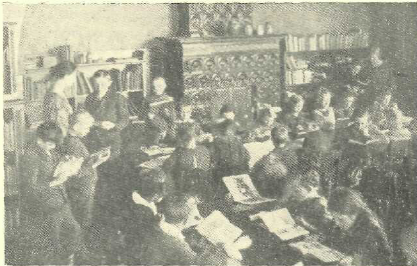
O bibliotecă populară de copii în Berlin

Societatea pentru răspândirea de cunoștințe populare între adulți (faptul că și-a schimbat numele în acela de „Societate pentru educația adulților” nu înseamnă nicio schimbare de metode) are o sarcină comparativ ușoară. Bunurile culturale pe care ea vrea să le dea, sunt la îndemână, gata să fie trecute mai departe. Societatea nu trebuie să caute să cearnă acest material din vreun punct de vedere științific, politic sau estetic. Fiecare e liber să vadă ce poate să