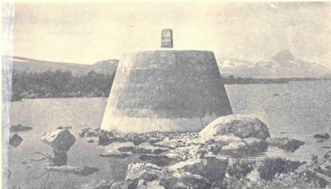
Piatra de hotar dintre Finlanda, Suedia și Norvegia

Pricina pentru care educația poporului s'a dezvoltat așa de târziu este că până în a doua jumătate a secolului trecut oamenii educați făceau parte din populația puțină de limbă suedeză, deosebită cu totul de ceice vorbeau limba fineză și față de cari nu erau decât un fragment (populația de limbă suedeză este astăzi cam de 11%). În zilele noastre sunt de trei ori mai multe școli de limbă fineză decât suedeză și între studenții dela universitatea de stat trei sferturi vorbesc fineza. Majoritatea profesorilor universității sunt și ei oa-