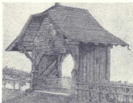
Cap de pod dela Sihl, în muzeul din Zürich (desen de băiat de 15 ani)

Peste nouăzeci de comitete, unele cu o viață de mai mulți ani și care lucrează pentru înaintarea intelectuală și sufle-