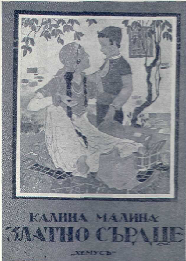
Coperta cărții pentru adolescenți de scriitoarea Kalina Malina (doamna Mitov)

Art. 4. — Autorii sau editorii, cari au imprimat sau litografiat în străinătate, fie în limba bulgară, fie în altă limbă, imprimatele indicate la art. 1 și care sunt menite să fie răspândite în hotarele țării, vor depune numai câte 4 exemplare.