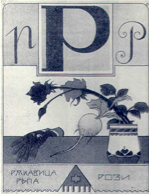
Planșă de abecedar desenat de pictorul Bojinov

§ 23. Dacă comitetul școlar nu depune suma prevăzută în