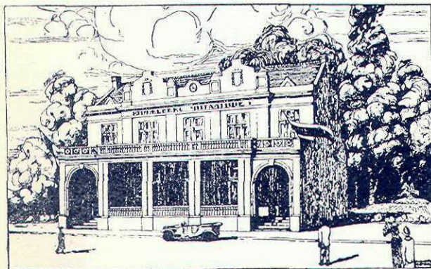
Citaliștea din Kneajevo (Sofia)

Sunt citaliști foarte puternice, cum sunt cele din Plevna, Varna, Rusciuc, Sliven, dar, în afară de citaliștea de oraș, dela Sofia, „Alec Constantinov“, autorul lui Bai Ganciu, am căutat să cercetez o citaliște de sat. Citaliștea din Kneajevo, de pildă, a fost înființată la 1917, din inițiativa