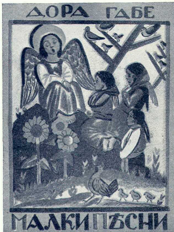
Coperta unei cărți pentru copii de poeta Dora Gabe

Art. 22. — Proprietarii de cinematografe, teatre sau ai